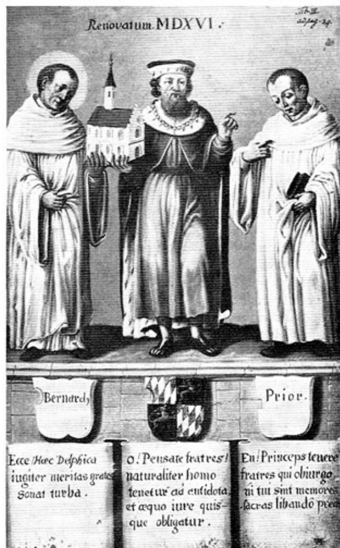
In der Mitte Herzog Ludwig der Strenge, rechts der Prior des Klosters, links der hl. Bernhard.