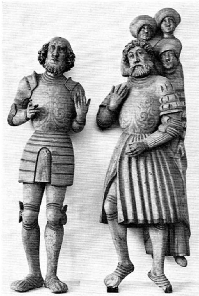
Reste des Stiftergrabes, heute im Bayer. Nationalmuseum, München.

Kurz vor seinem Tode bestimmte Herzog Ludwig in seinem letzten Willen, daß sein Leichnam in dem von ihm gestifteten Kloster Fürstenfeld beigesetzt werden solle. Als er dann am 1. Februar 1294 in seinem Residenzschlosse zu Heidelberg die Augen geschlossen hatte, wurde sein Körper nach der damals üblichen Sitte ausgeweidet, so daß man die Knochen in einer Kiste leicht über eine größere Strecke befördern konnte. Über Einzelheiten der Bestattungsfeier sind wir nicht unterrichtet. Wir wissen aber, daß entsprechend dem letzten Willen neben der Klosterkirche eine besondere Begräbniskapelle für den Herzog und die Angehörigen seines Hauses errichtet wurde. Wie dieses Mausoleum ausgesehen hat, ob es eine schlichte gotische Kapelle oder ein Rundbau war, ist uns nicht bekannt. Wir wissen lediglich, daß sie im Garten des Klosters stand und daß am Todestage des Herzogs in jedem Jahre in dieser Kapelle ein feierliches Totenamt gelesen wurde. Für diesen Zweck hatte der Herzog eigens einen Kelch geschenkt, der auch mehrere hundert Jahre benutzt worden ist, bis er dann im Jahre 1803 an die Münze zu München abgeliefert werden mußte und dort im Feuer zerschmolz.