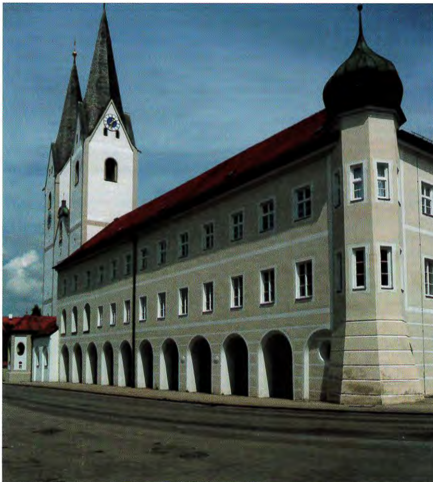
Abb. 1: Stift Indersdorf.