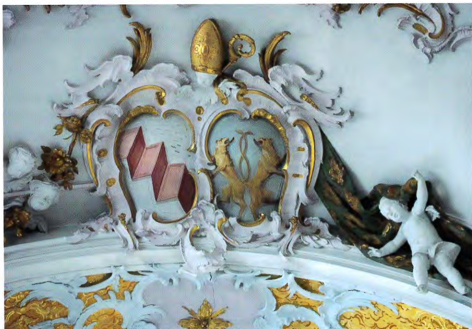
Abb. 2: Wappen des Stiftes Indersdorf und zugleich das von Propst Gelasius Morhart. Anders als seine Amtsvorgänger fügte er kein drittes Wappenschild mit persönlichen heraldischen Motiven mehr hinzu, die z. B. auf seine örtliche oder familiäre Herkunft hingewiesen hätten.

von Neustift bei dessen Wappen nachweislich unzutreffend: er wurde bereits am 2. Oktober des Jahres 1705 als Franziskus Hainbogen 7 in Freising getauft 8 . Das Geburtsjahr des Fürstenfelder Abts Alexander Pellhamer 1695 hingegen ist korrekt 9 . Wie verhält es sich also mit dem dort angegebenen Geburtsjahr 1709 von Propst Gelasius Morhart – richtig oder falsch?