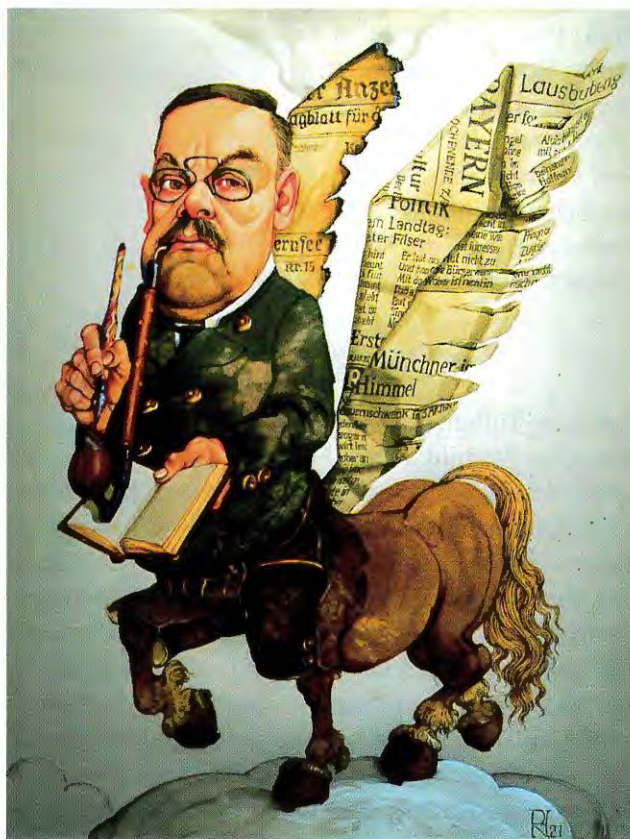
Abb. 1: Ludwig Thoma in den Augen des Künstlers Hans Reiser, 2010 (Foto: H. Reiser).

Die Originalurkunde, vom damaligen Oberbürgermeister Borscht (1857–1943) signiert, ist in der Monacensia zu finden (unter der Signatur L 2467/2); die einschlägigen Meldeunterlagen sind im Stadtarchiv München einsehbar. Daraus geht auch hervor, dass Thoma unter der Nummer 5.624 in die Liste der Landtagswähler eingetragen war. 4 Das Haus „Auf der Tuften“, seit den 1960er-Jahren im Eigentum der Landeshauptstadt, liegt am Süzipfel der Stadt Tegernsee und steht heute Besuchern aus aller Welt als Literatur-Denkmal offen. 5 Zu der falschen Zuschreibung zu Rottach, die sich wie ein roter Faden durch die Forschungsliteratur zieht, trug Thoma nolens volens selbst bei, wie über Jahre hinweg seine Privatpost zeigt. Bereits seit Sommer 1908 taucht im Briefkopf kontinuierlich die Ortsmarke Rottach auf, aus einem simplen Grund: Briefe und Telegramme zur Tuften wurden seinerzeit nicht vom Postamt in Tegernsee, sondern von Rottach aus zugestellt. Im Brieftext sprach Thoma hingegen fortwährend von Tegernsee. Seine letzte Ruhestätte an der Seite seines väterlichen Freundes Ludwig Ganghofer (1855–1920) auf dem Egerner Friedhof schien diese Zugehörigkeit zu legitimieren. 6