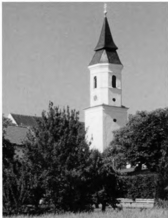
Der Turm der Kirche St. Stephanus in Paunzhausen prägt das Ortsbild.

Mit dieser Anzeige rief das Landgericht Freising zu Spenden für die Geschädigten der Brandkatastrophe von Paunzhausen auf.