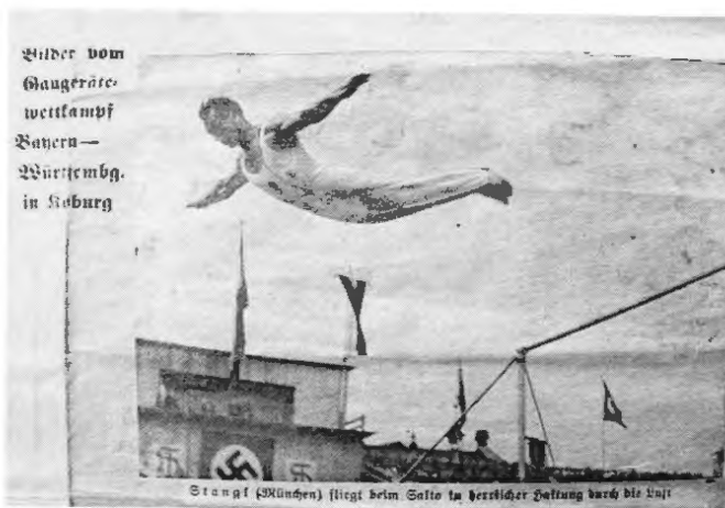
Stangl beim Salto am Reck bei einem Gauwettkampf Bayern-Württemberg in Koburg (Datum unbekannt).

Im Januar 1940 wurde Stangl zur Wehrmacht eingezogen. Er diente als Funker in einer Nachrichtenabteilung, wurde Unteroffizier und im Juni 1943 Nachrichtentruppführer. Der Olympiasieger kämpfte in Frankreich (1940), Rumänien, Bulgarien und Serbien (1941), Russland (1941–1944) und Polen (1944/45). 47 Im Mai 1945 geriet er in amerikanische Kriegsgefangenschaft, wurde den sowjetischen Truppen übergeben und flüchtete auf dem Marsch in Richtung Osten zu Fuß aus der Tschechoslowakei nach Hause. In München meldete sich Stangl wieder bei den US-Behörden, wurde ins Kriegsgefangenenlager nach Bad Aibling geschickt und im September 1945 entlassen. 48