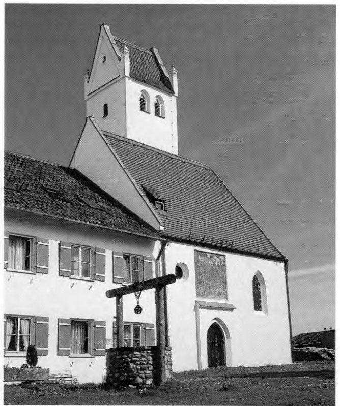
Wittelsbacher Memorialkapelle in Hoflach bei Alling/Lkr. Fürstenfeldbruck

derbayern starb und das Erbe an seinen erst sieben Jahre alten Sohn Heinrich (XVI., den Reichen; reg. 1393–1450) fiel, was umgehend zu Auseinandersetzungen unter den übrigen Herzögen über dessen Vormundschaft und am Weihnachtsabend 1394 zum ersten hayerischen Hauskrieg von sechs Wochen Dauer führte. Nach dem Tod Herzog Johanns II. 1397 verstanden es die Herzöge von Ingolstadt, Stephan III. und sein Sohn Ludwig, den ausbrechenden Bürgerkampf zwischen Patriziern und Zünften in München für ihr Interesse an einer