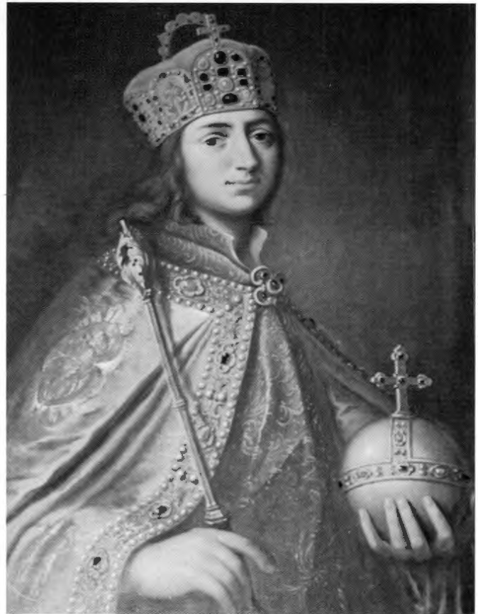
Ludwig der Bayer in den Augen des 19. Jhs. im Stadtmuseum Aichach