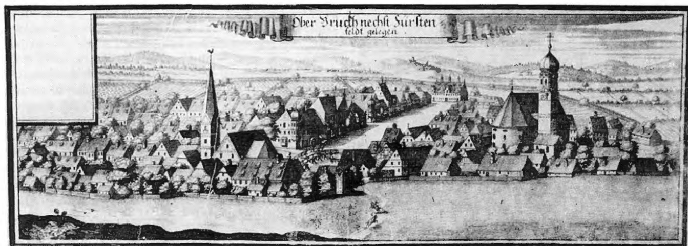
»Ober Bruckh nechst Fürstenfeldt gelegen«, Michael Wening, 1701, Kupferstich, 13 x 35,7 cm