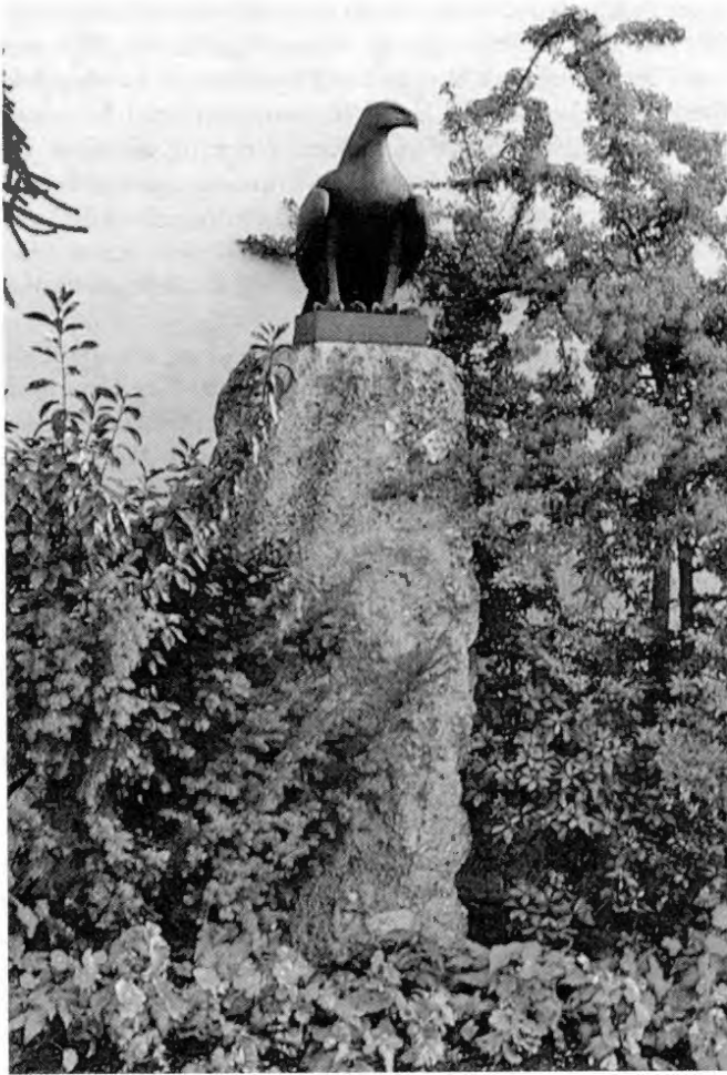
Als Geschenk der bayerischen Staatsregierung überbrachte der damalige Innenminister Adolf Wagner einen »kühn blickenden Adlers, der auf schroffen Felsen stehend die junge Stadt bewachen sollte.