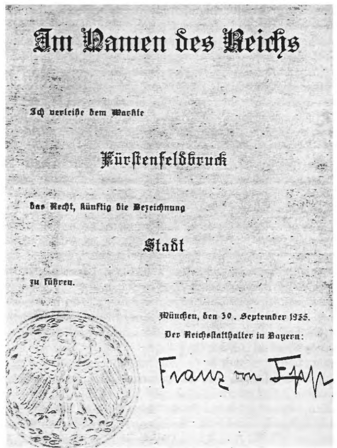
Die Stadterhebungsurkunde (nur mehr in Ablichtung erhalten).

Es ist selbstverständlich, dass eine Beschäftigung mit der »Normalität« des NS-Staates oder mit den genannten »weißen Flecken« der Forschung nicht heißt, dass man die zentralen Aspekte des Unrechtsregimes vergisst oder ausblendet. Die unmenschliche Ideologie, Zwangsmaßnahmen, Ausgrenzung, Judenverfolgung, Terror, Vernichtung, Kirchenkampf und Widerstand sind präsent, auch wenn von kommunaler Siedlungspolitik, Verkehrsausbau, Gewerbeförderung oder eben von einer Stadterhebung die Rede ist. Innenseite und Schauseite des Regimes gehören zusammen.