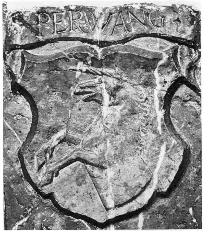
Wappen der Perwanger