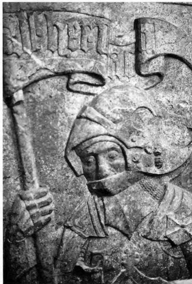
Ausschnitt aus dem Epitaph für Jeronimus Perwanger, 1507