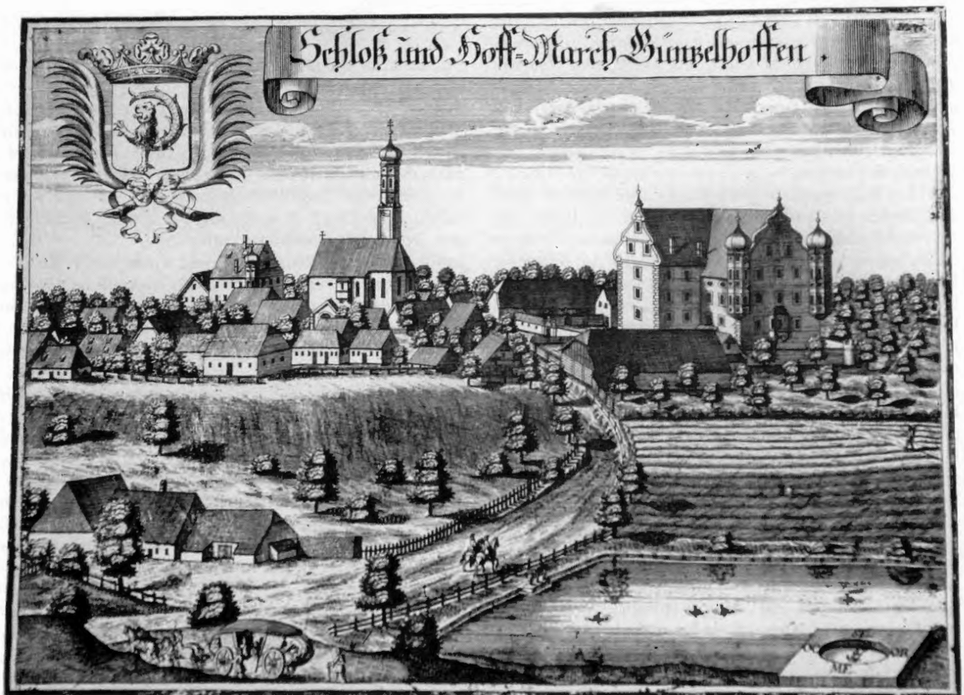
Schloss Günzlhofen, Kupferstich von Michael Wening, um 1701