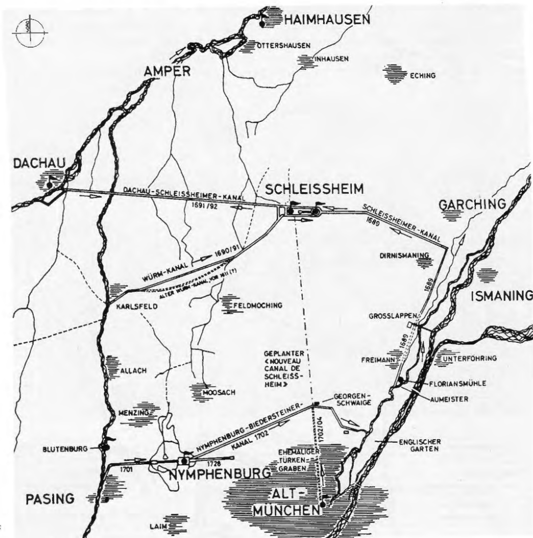
Lage und Erstreckung des Schleißheimer Kanalsystems Aus: Gerhard Hojer u. Elmar D. Schmid: Schleißheim. Neues Schloss und Garten. München 1989.