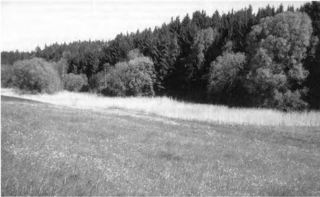
1 Westteil des Feuchtgebietes in einem asymmetrischen Tal