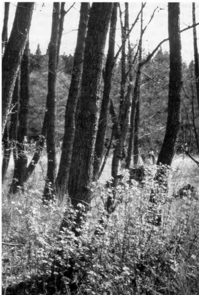
6 Schwarzerlen mit Johannisbeerstrauch