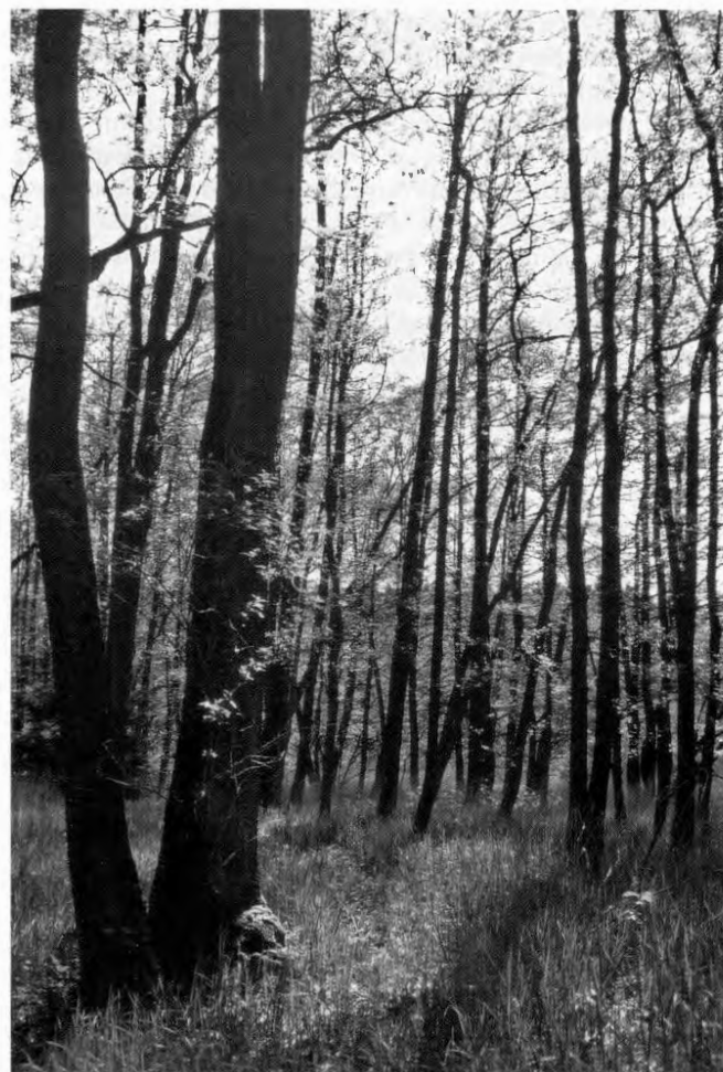
7 Johannisbeer-Erlen-Eschen-Auenwald, Ausprägung mit Rohrglanzgras