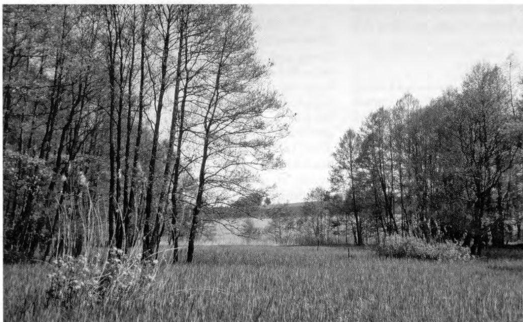
3 Streuwiese im Altgraben-Tal mit Johannisbeersträuchern als Vor- posten des Waldes