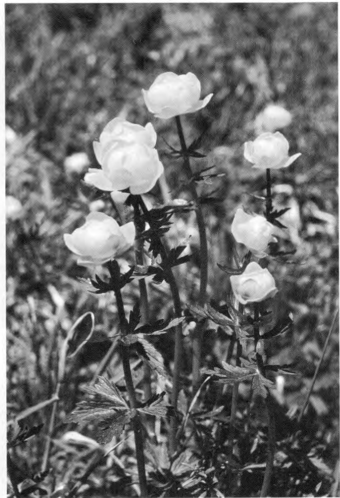
5 Trollblume ( Trollius europaeus )