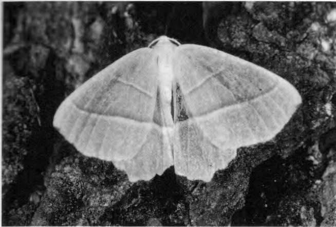
11 Spanner-Art ( Campaea margaritata )