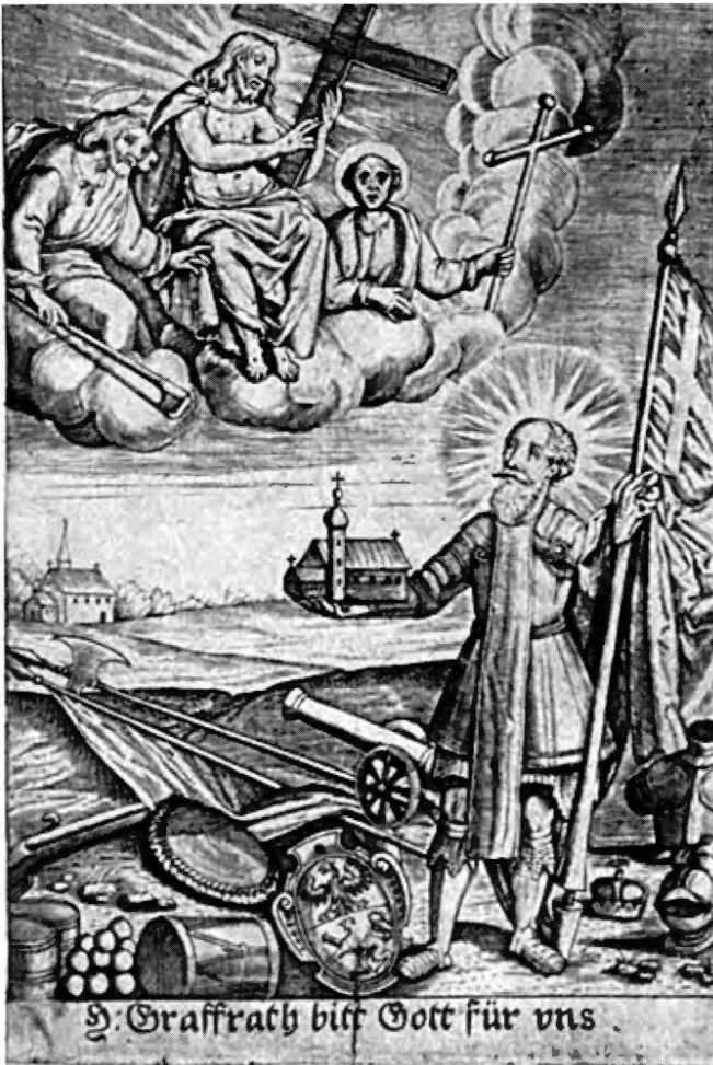
Andachtsbild um 1593, 11 x 7,5 cm. Im Hintergrund alte Kirche, darüber die Kirchenpatrone St. Salvator und Apostel Philippus und Jakobus, im Vordergrund der heilige »Graffrath« mit Modell der 1593 erweiterten Kirche (Vorgängerbau der jetzigen Kirche).