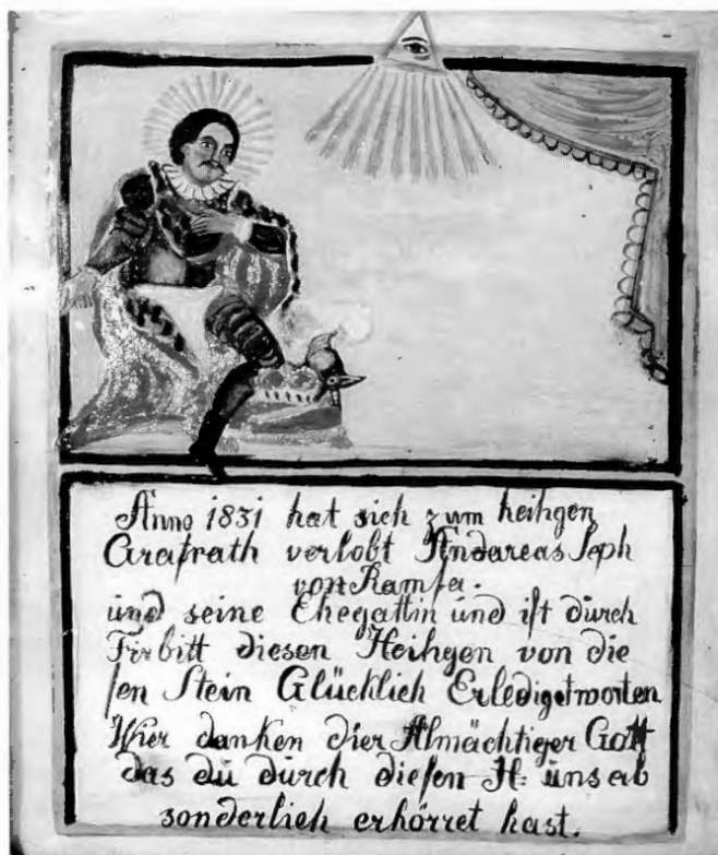
Votivtafel von Grafrath.

Dass der Name Rasso/Razzo auf Rato, eine Kurzform von Ratold, Ratpot 24 oder Ratfrid 25 zurückgeht, ist durchaus möglich. Zu erklären wäre dies durch die Verschiebung des stimmlosen Verschlusslautes »t« (nach Vokal) zum Reibelaut »z«, die sich nach den Erkenntnissen der Sprachwissenschaft hauptsächlich im 6./7. Jahrhundert im Rahmen der so genannten Althochdeutschen Lautverschiebung vollzog. 26 Auf diese Lautverschiebung kann man sich jedoch zur Erklärung des Falles »Grafrath/ Rasso« aus mehreren Gründen nicht berufen. Zunächst handelte es sich bei dem letzten Laut von Grafrath wohl nicht um einen stimmlosen Verschlusslaut, sondern um einen behauchten oder stimmhaften Dental, wie man aus der am häufigsten vorkommenden Schreibung mit th oder d – Letzteres im Lauf des 7. bis 9. Jahrhunderts allgemein anstelle des th – erschließen kann. Bei den Dentalen