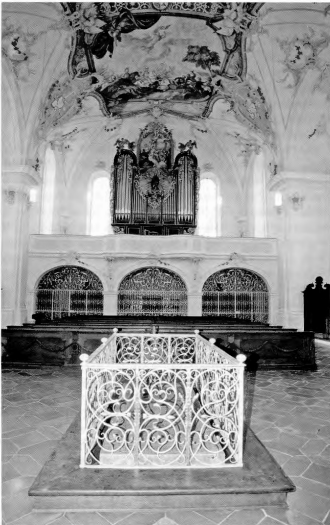
Stiftergrab von Grafrath. Rotmarmor-Grabplatte, angefertigt für das Hochgrab im Jahre 1468, seit Niederlegung des Hochgrabes und Erhebung der Gebeine auf den Hochaltar im Jahre 1695 am Boden liegend.

Zerstörung des Klosters durch Herzog Arnulf erscheint bei einer früheren Datierung der Klostergründung nicht mehr unsinnig, sondern besitzt zumindest den gleichen Stellenwert wie bei den anderen in diesem Zusammenhang genannten Klöstern. Warum sollte sie auch erfunden worden sein, wenn die Zerstörung des Klosters wirklich auf die Ungarn zurückging? Auch andere Angaben der Andechser Überlieferung werden bei einer früheren Datierung interessant, so zum Beispiel in der ältesten Chronik von Andechs die Aussage, der Klostergründer von Grafrath sei »von sinen vorfarn ain her von Franckrich gewesen«, oder im Andechser Missale die Stelle, wo von Pippin (770–811), dem Sohn Karls des Großen, und seinen Kämpfen gegen die Ungarn »zur Zeit des Grafen Rasso von Racenberg« die Rede ist. 73 Es ist bekannt, dass Karl der Große, nachdem er den bayerischen Stammesherzog Tassilo entmachtet hatte, zur Verwaltung des Landes Grafen einsetzte und kurz darauf die kriegerischen Auseinandersetzungen mit den Awaren oder Hunnen (791–803) seinem Sohn Pippin und Grafen überließ. 74 Man könnte sich vorstellen, dass der Klostergründer von Grafrath einer jener namentlich nicht genannten Grafen war, die von König Karl (oder seinem Nachfolger) zur Verwaltung Bayerns eingesetzt und gleichzeitig zum Schutz der Ostgrenze verpflichtet worden waren. 75 Bei einer Datierung in die Karolingerzeit deuten sich auch eher Lösungen für die oben aufgeworfenen Fragen an. Zunächst wäre in diesem Fall das Problem mit dem Namen