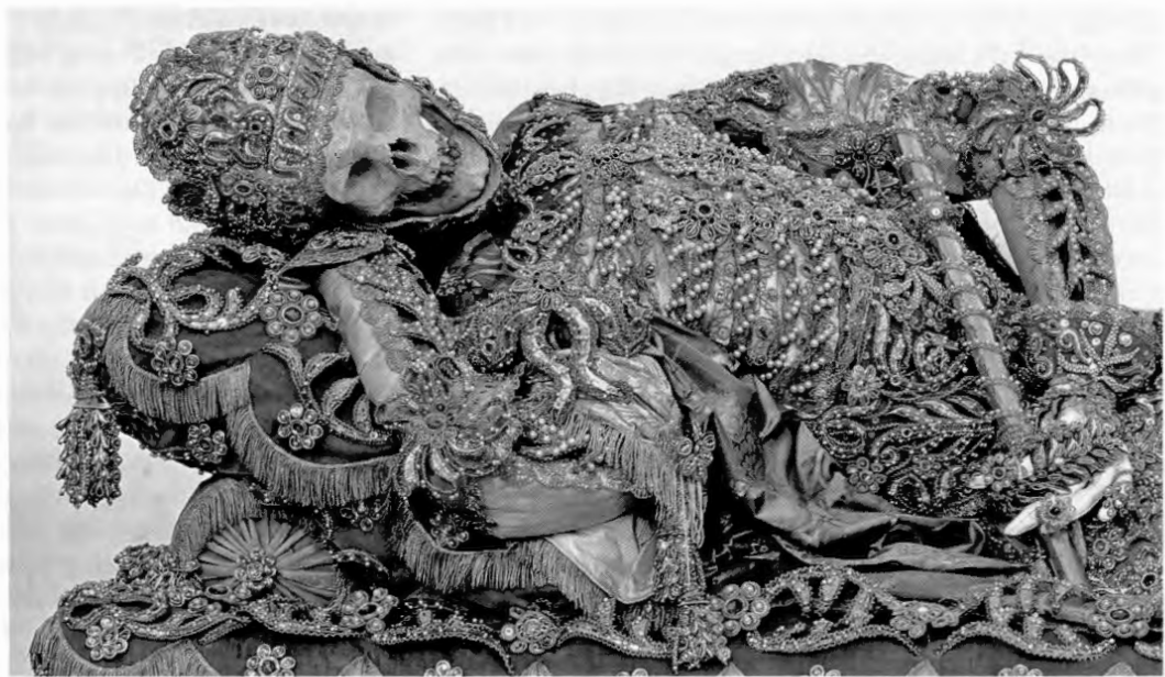
Gebeine des Kirchenstifters auf dem Hochaltar in der Fassung von 1867 (barocke Fassung von den »Rassoräubern« zerstört).