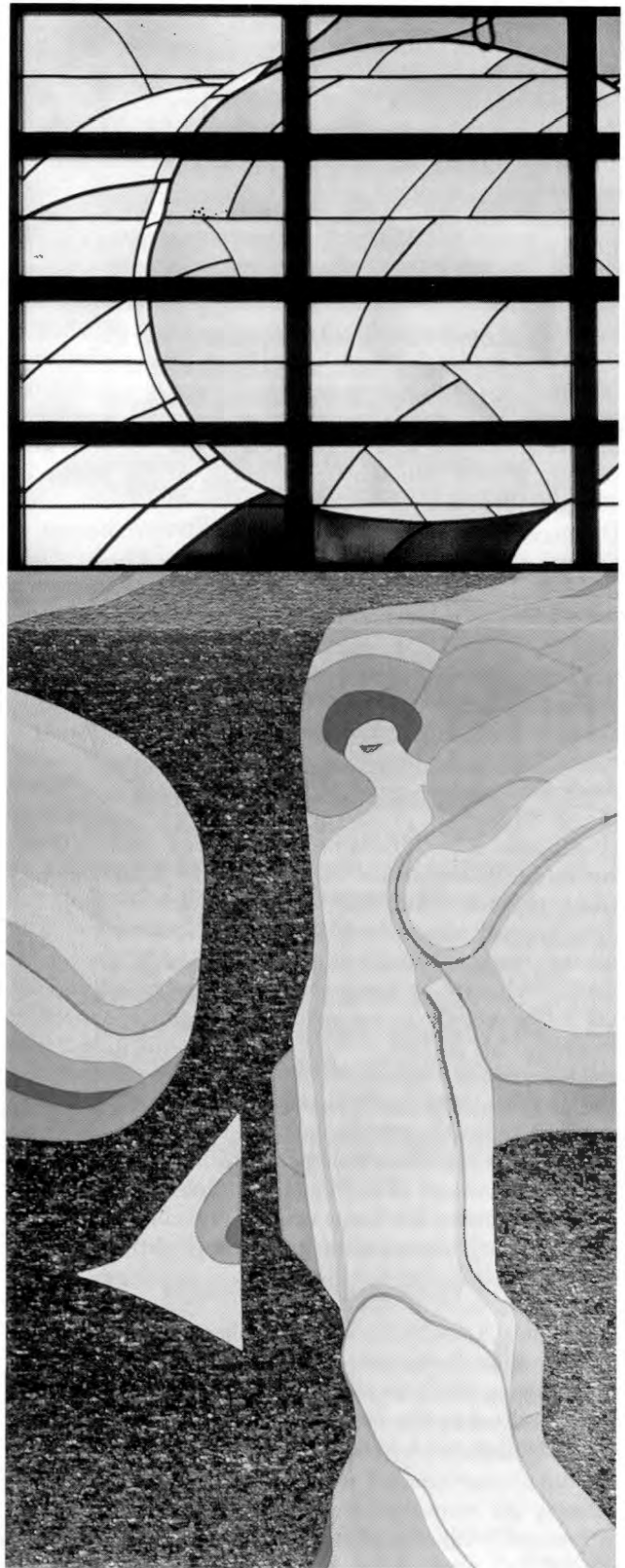
Hubert Distler: »Verkündigung«, Altarwandfenster und Wandteppich in der Evang.-Luth. Kirche Maisach, 1985.

»Die gesamt-künstlerische Bedeutung Hubert Distlers wird sich aber, was die angewandte oder Auftragskunst anbelangt, wahrscheinlich in der Kirchen- oder monumentalen Malerei erweisen«, schrieb Bernhard Bach 9 vom Evangelischen Landeskirchenamt 1989 anlässlich des 70. Geburtstags des Künstlers. Und er fuhr fort: »Die Nachkriegszeit hat nämlich neben seinem Malerkollegen und Zeitgenossen Rudolf Büder [1920–2002] und ihrem gemeinsamen Lehrer Franz Nagel [1907–1976] kaum so bedeutende monumentale Kirchenmaler und Gestalter mit dieser künstlerischen Qualität hervor gebracht. Darüber hinaus hat der protestantische Kirchenraum in Distler (wie in Büder) die künstlerische Ausgestaltung in einer Art und Weise erfahren, wie sie in der eher bescheidener anzusetzenden evangelischen Architektur und