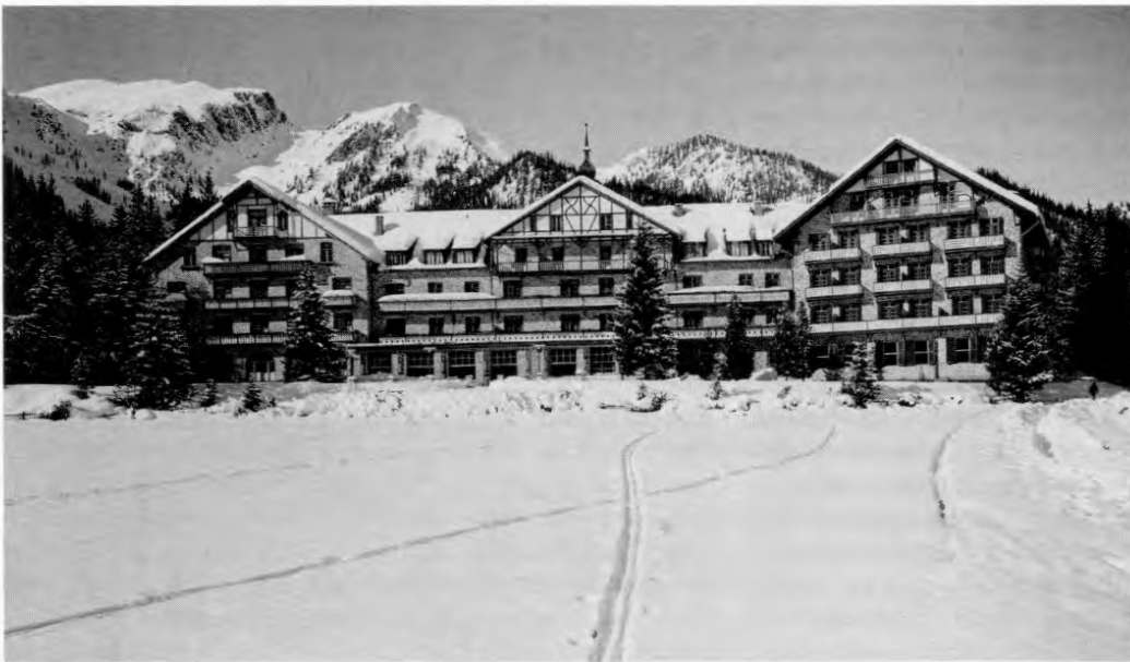
Das Hotel »Pragser Wildsee«, das in fast 1500 Meter Höhe in einem Seitental des Pustertales in Südtirol liegt, ist das Ziel des Geiseltransports, als die Sippen- und Sonderhäftlinge am Abend des 27. April 1945 zur letzten Etappe ihres Leidensweges im Lager Reichenau bei Innsbruck aufbrechen.