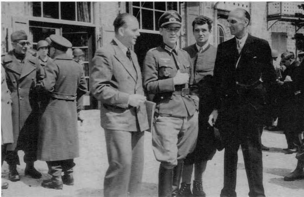
Der Oberst im Generalstab Bogislav von Bonin, der sich selbst als Sonderhäftling unter den Geiseln der SS befindet, holt mit einem Telefonanruf in Bozen die Deutsche Wehrmacht zu Hilfe. Auf dem Bild ist er in voller Uniform nach der Befreiung der Gefangenen auf der Terrasse des Hotels »Prager Wildsee« zu sehen.