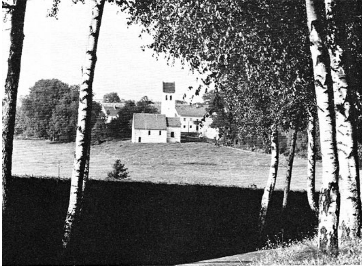
Steinkirchen bei Dachau.