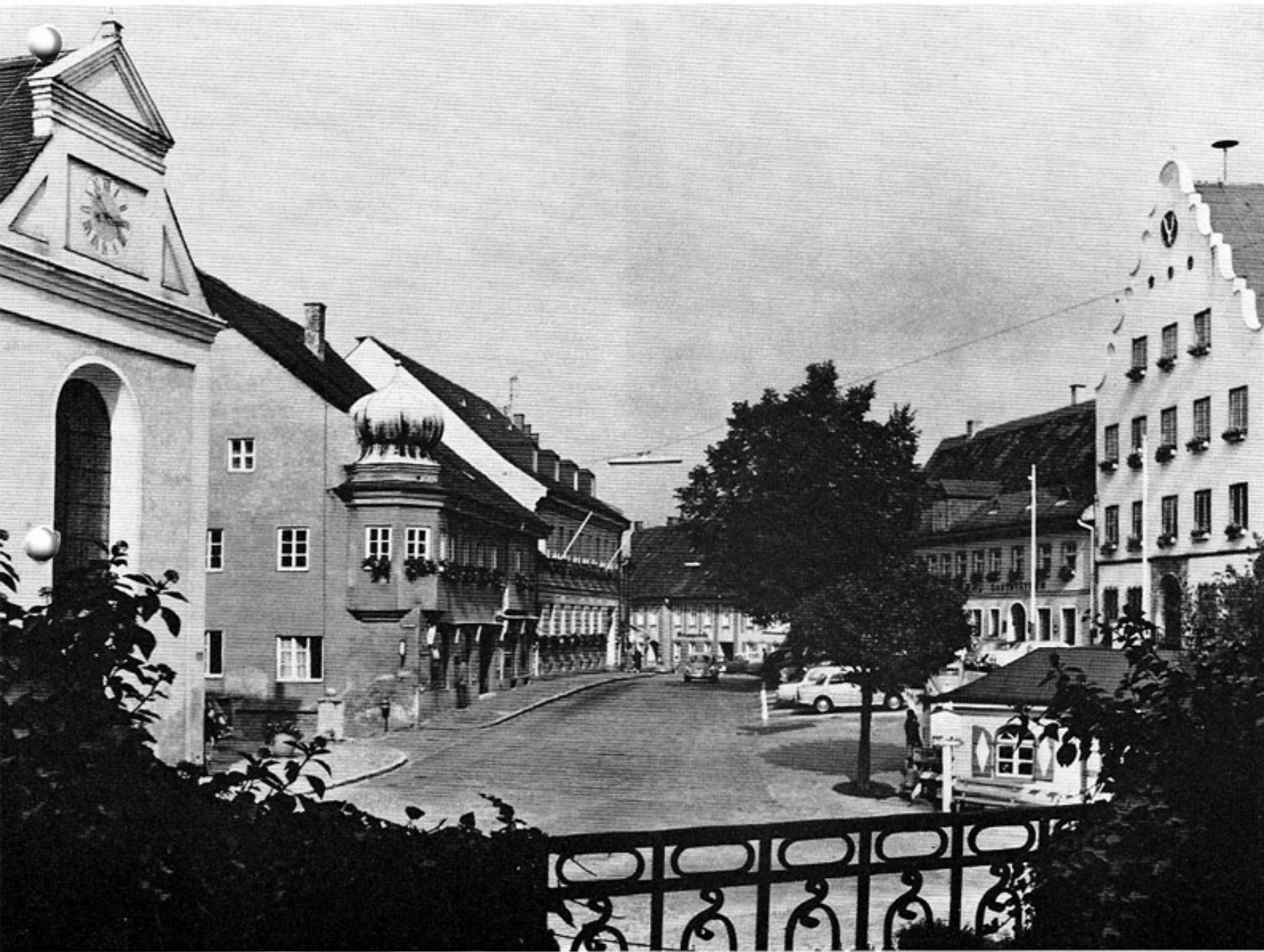
Im Zentrum des alten Marktes. Links Pfarrkirche St. Jakob, rechts Rathaus.

seine weitere Entwicklung im 19. Jahrhundert bis zum heutigen Tag noch in großen Stichen geschildert wird, anzumerken, daß der jeweilige Bürgermeister bzw. ein Vertreter des Rates Mitglied der alten bayerischen Landschaft, der Vorläuferin des heutigen Landtages, war. Urkundlich ist das Erscheinen eines Vertreters des Marktes Dachau auf dem Landtag von 1456 zum ersten Male nachzuweisen. Die Vertretungsorgane im alten Markt Dachau waren seit dem 14. Jahrhundert der Rat und die Bürgermeister. Im 15. Jahrhundert tritt ein Gremium von sechs geschworenen Ratsmitgliedern auf, das im 18. Jahrhundert als „innerer Rat“ bezeichnet wird. Daneben bestand seit dem 17. Jahrhundert als Kontrollorgan ein „äußerer Rat“ mit gleichfalls sechs Mitgliedern sowie eine die Gesamtheit der Bürger ersetzende „Gemein“, die ebenfalls sechs Mitglieder zählte. Die jährlich stattfindenden Ratswahlen bedurften jeweils der Bestätigung durch den Pfleger von Dachau.