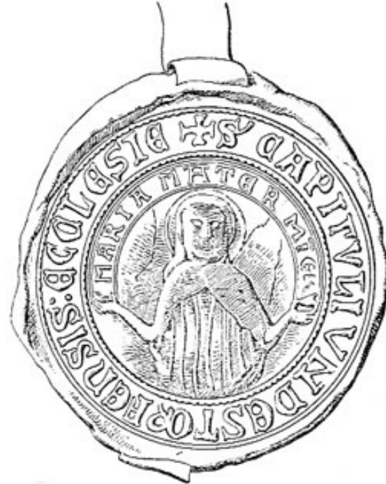
Siegel des Augustiner-Chorherrenstifts Indersdorf, 15. Jahrhundert

Als Nachfolger wurde der bereits genannte Stiefbruder des Propstes Erhard Prunner (Rothuet) — Johannes 1. Rothuet — ausgewählt. Dieser stand dem Kloster Indersdorf von 1442 bis 1470 vor. Wenn man bedenkt, daß die Führung dieses Klosters 58 Jahre lang in solch kontinuierlicher Konstanz und Konsequenz erfolgt ist, mußte eine religiöse Erneuerung, eine innere Gesundung und ein wirtschaftlicher Aufschwung zu verzeichnen sein, der auch seine belebende Wirkung weitergeben konnte.