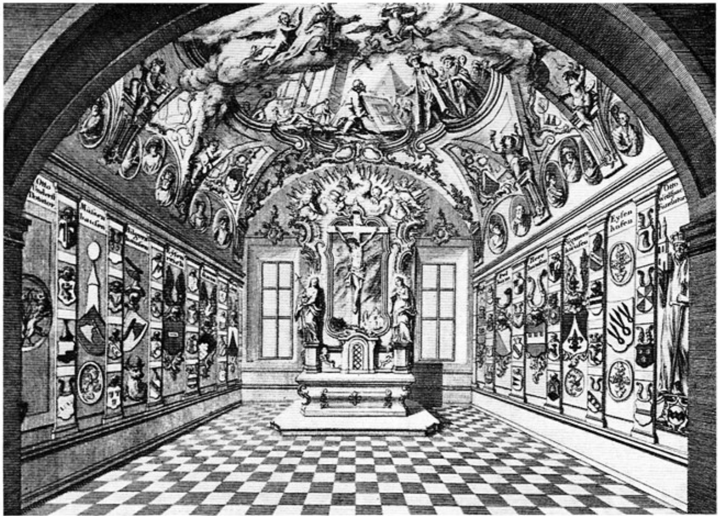
Kloster Indersdorf, Erdbegräbniskapelle

Hier steckte die Wurzel der Verarmung der Gemeinschaft und der Stifte, der Verfall der Gebäulichkeiten. Verschuldung trat ein; Klostergut mußte verkauft werden, um den einzelnen Konvent erhalten zu können. Die Gefahr — und leider auch die Praxis — der Simonie war gegeben, das