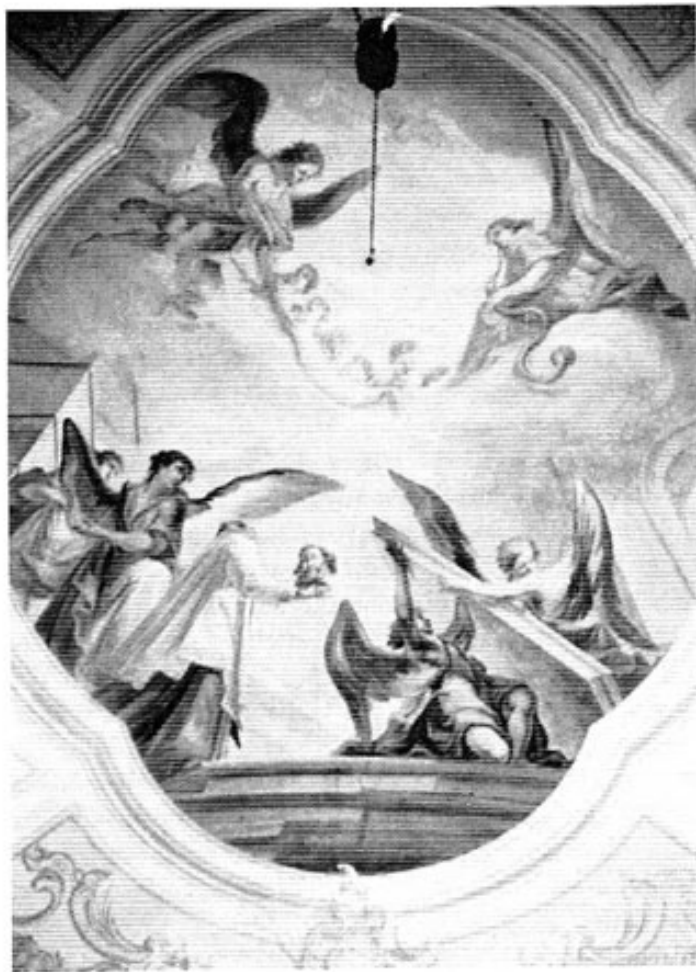
Eisenhofen, Deckenbild, Aufnahme St. Albans in den Himmel, Fresko von Johann Georg Dieffenbrunner