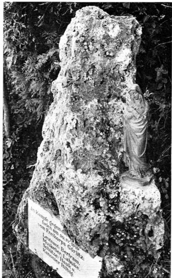
Gedenkstein für die Gefallenen des Freikorps Görlitz an der Straße von Breitenau nach Pellheim