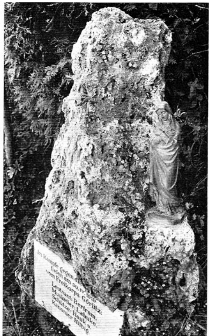
Gedenkstein für die Gefallenen des Freikorps Görlitz an der Straße von Breitenau nach Pellheim