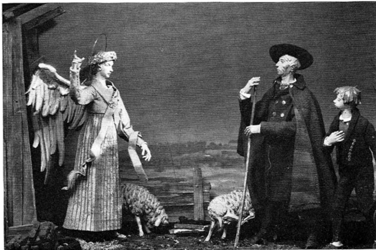
Der Engel verkündet den Hirten die Geburt Christi. Detailaufnahme aus der Heimatkrippe der Familie Huber, Dachau.