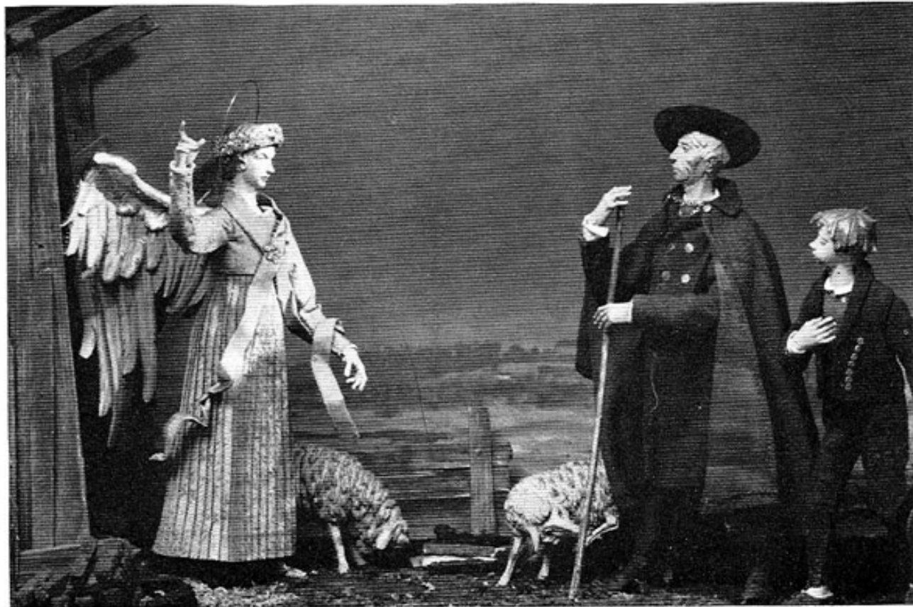
Der Engel verkündet den Hirten die Geburt Christi. Detailaufnahme aus der Heimatkrippe der Familie Huber, Dachau.