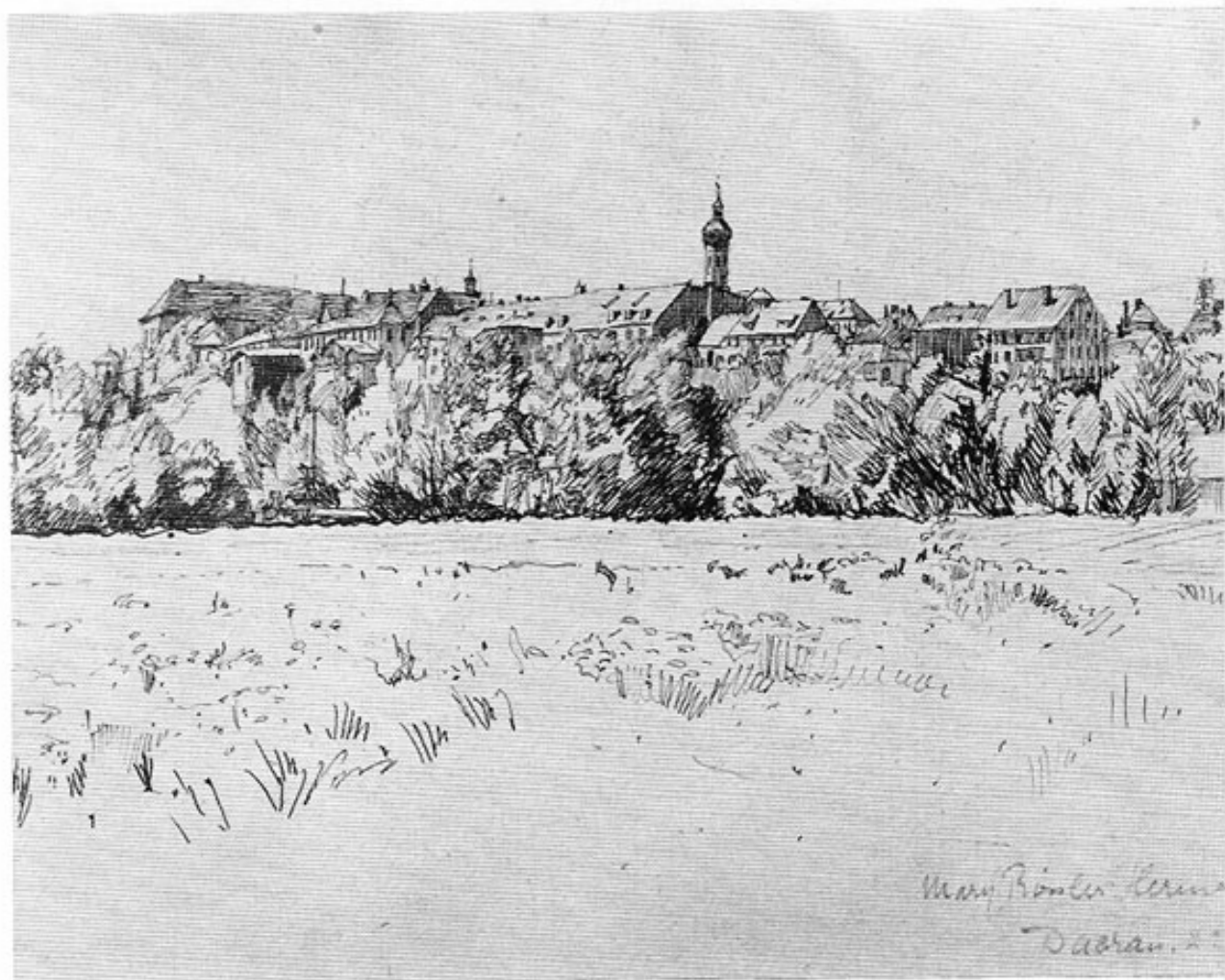
Mary Rössler-Hermes: Ansicht von Dachau (1922). Federzeichnung 23 x 29 cm.

dieses Ausstellungssommers gab es auch andere künstlerische Veranstaltungen. So gastierte Ernst von Wolzogens