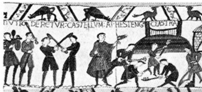
Abb. 1: Bild aus dem Teppich von Bayeux (um 1100 n. Chr.). Der Bau einer Motte durch Erdarbeiter.

täler eingeschnitten, so daß sich in den Plateaus im Laufe der Zeit »Bergsporne« oder »Bergnasen« von unterschiedlicher Breite und Länge bildeten. Sie fallen gewöhnlich auf drei Seiten steil in das Flußtal ab und sind nur noch auf einer Seite durch einen »Steg« mit dem Plateau verbunden. An der Amper, dem Lech und an der Würm kann man diese Spornbildung durch Erosion der Querbäche in großer Anzahl finden, die, wenn sie groß genug waren, wohl ausnahmslos zur Anlage eines Erdwerkes ausgenutzt worden sind.