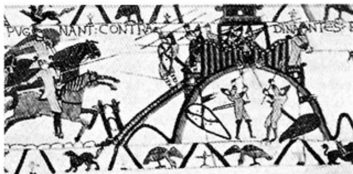
Abb. 2: Bild aus dem Teppich von Bayeux (um 1100 n. Chr.). Die Motte von Dinan wird von Soldaten gestürmt und verbrannt. Die Palisadenbefestigung und der Holzturm auf dem Gipfel sind deutlich zu erkennen.

Die von den Alpen zur Donau fließenden großen und kleinen Flüsse und deren Nebenarme haben in den begleitenden eiszeitlichen Schottermoränen tiefe Längs- und Quer-