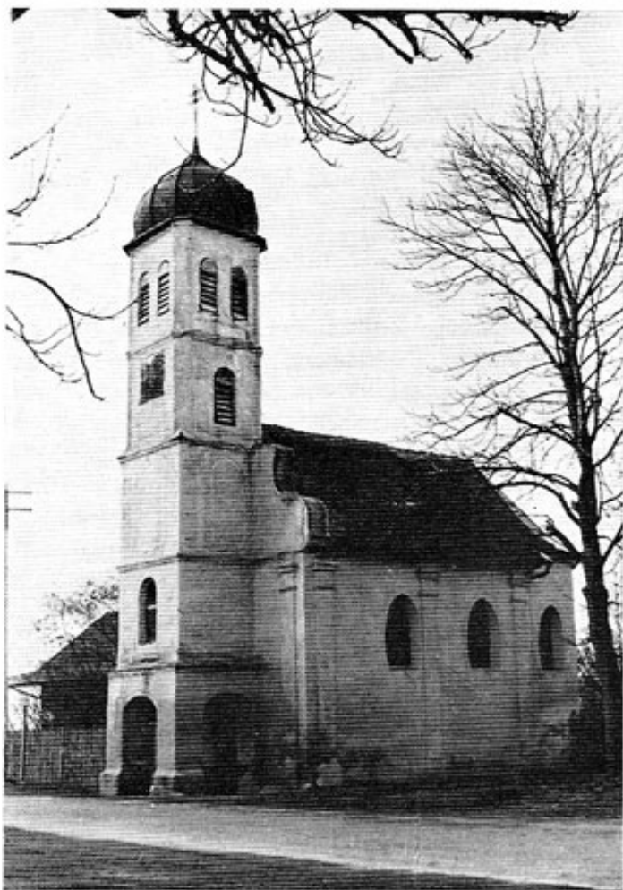
Die Johannes-Nepomuk-Kapelle in Geiselbullach. Blick von Osten.