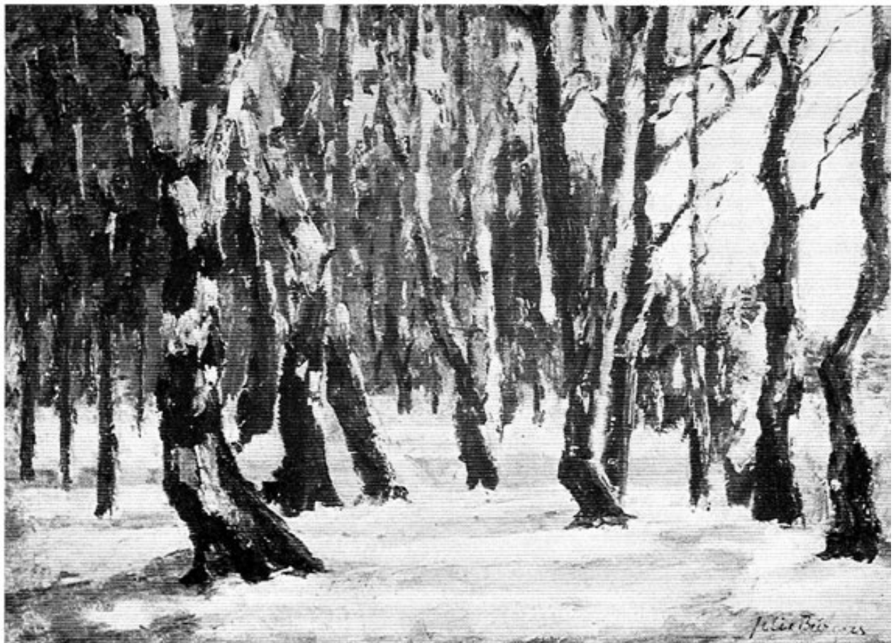
Felix Bürgers: Birkenwald im Dachauer Moos (Öl).

Nicht unerwähnt sollen seine »Waldbilder« bleiben, zumeist Birkenwälder in den Stimmungen der verschiedenen Jahreszeiten, Frühling, Herbst. Er führt dabei selten ins Waldinnere, gibt oft nur das Hintereinander der zahllosen Baumstämme, die Baumkronen fehlen.