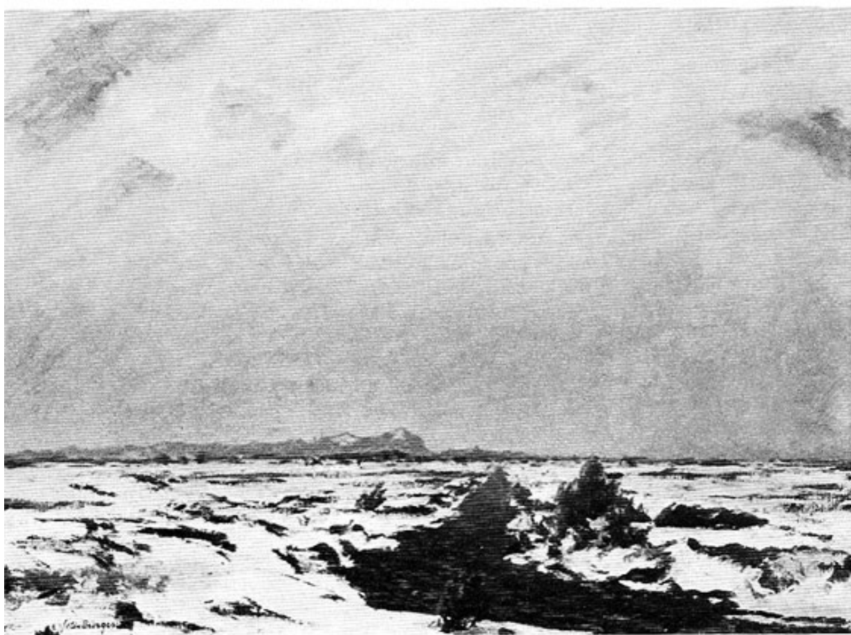
Felix Bürgers: Bei Dachau. Blick auf die Zugspitze (Öl).