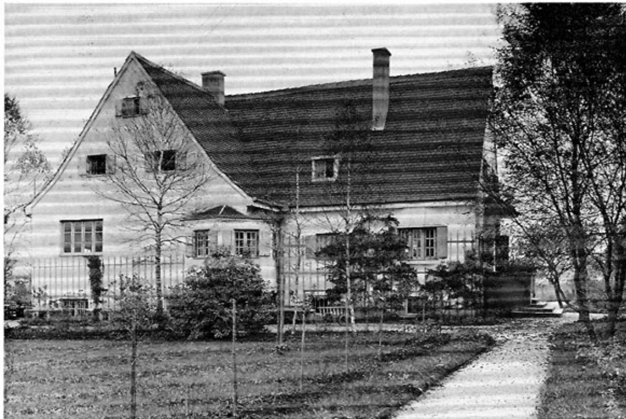
Abb. 2: Haus Ruckteschell in Dachau, Münchner Str. 84.