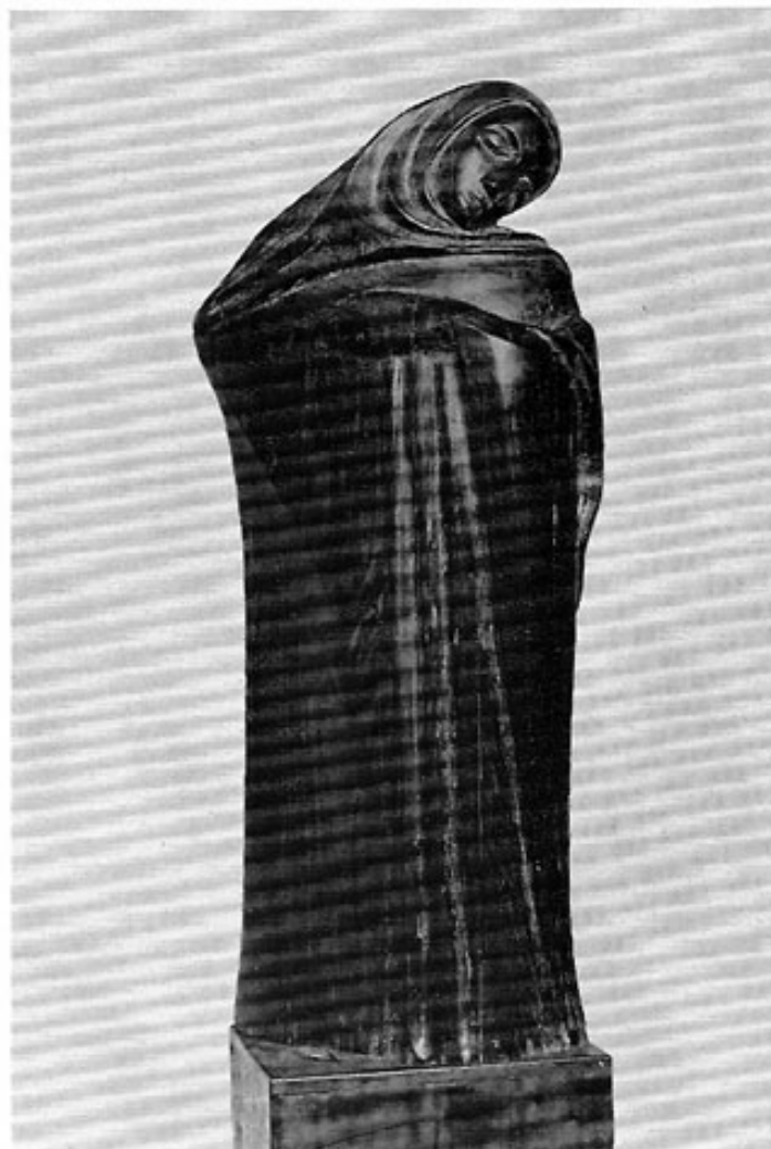
Abb. 4: Walter v. Ruckteschell, Ebenholzfigur, 1914.

paar vorübergehend im Hause des Malers Ludwig Dill an der Holzgartenstraße. Später erwarb Ruckteschell ein kleines Haus an der Münchner Straße, das er erweiterte und