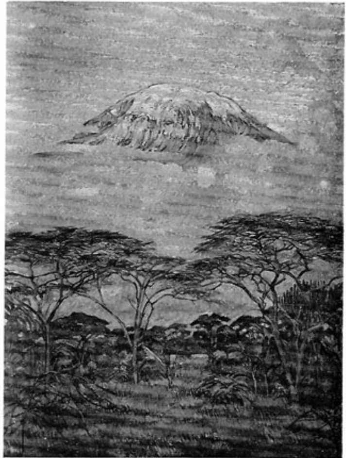
Abb. 3: Walter v. Ruckteschell, Der Kilimandscharo , Gemälde, 1913.

zunächst garnichts mit dem Ort zu tun. Aber er versuchte hier — als ein völlig Fremder — Boden zu gewinnen. Was lag damals schon hinter dem erst 38 jährigen!