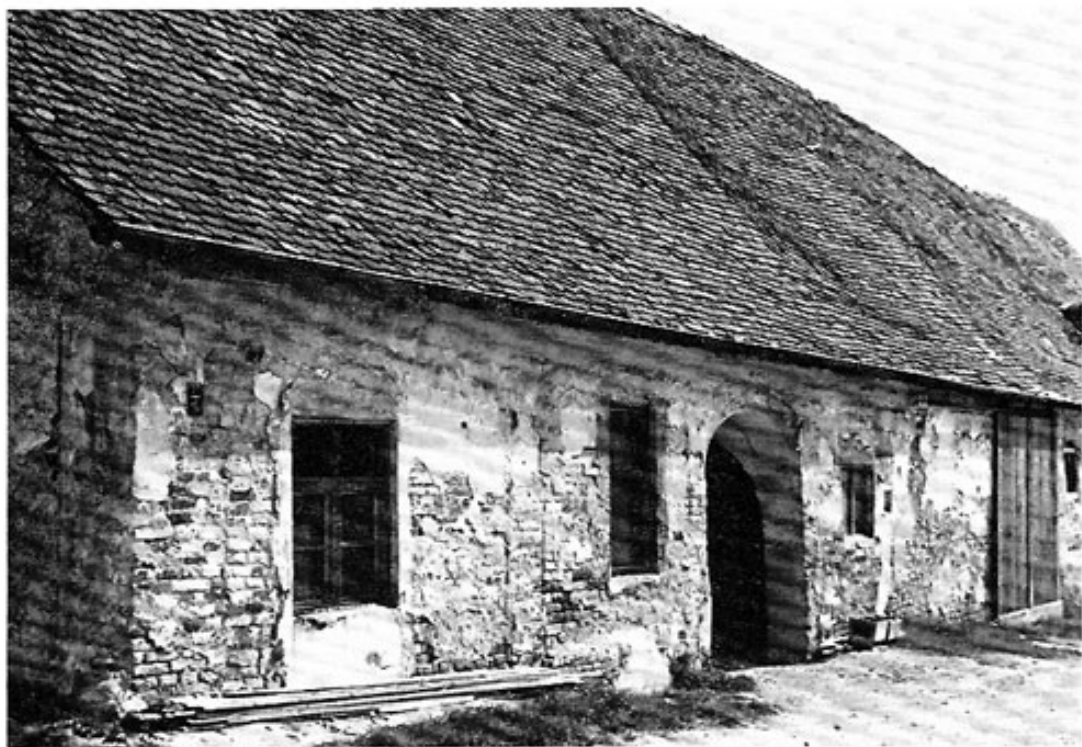
Ehemaliger Poststall beim Postwirt in Schwabhausen. Erbaut ca. 1792.