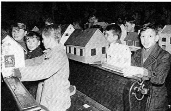
Lucienhäusl bei der Weibe in der Stadtpfarrkirche Fürstenfeldbruck.

»Hochwürdigster, hochgeborener Reichsfürst, gnädigster Herr! Euer hochfürstliche Gnaden gnädigster Befehl, datiert den 18. Februar, habe ich den dritten Morgen darauf mit untertänigstem Respekt erhalten und daraus ersehen, daß am St.-Lucia-Fest nächst Fürstenfeld dieser Mißbrauch eingeschlichen, daß man papierene Häusl samt einem Licht auf die Amper setzt und dann herabrinnen ließ. Ich habe mich darüber unverweilt informiert und erstatte darüber meinen untertänigsten Bericht: