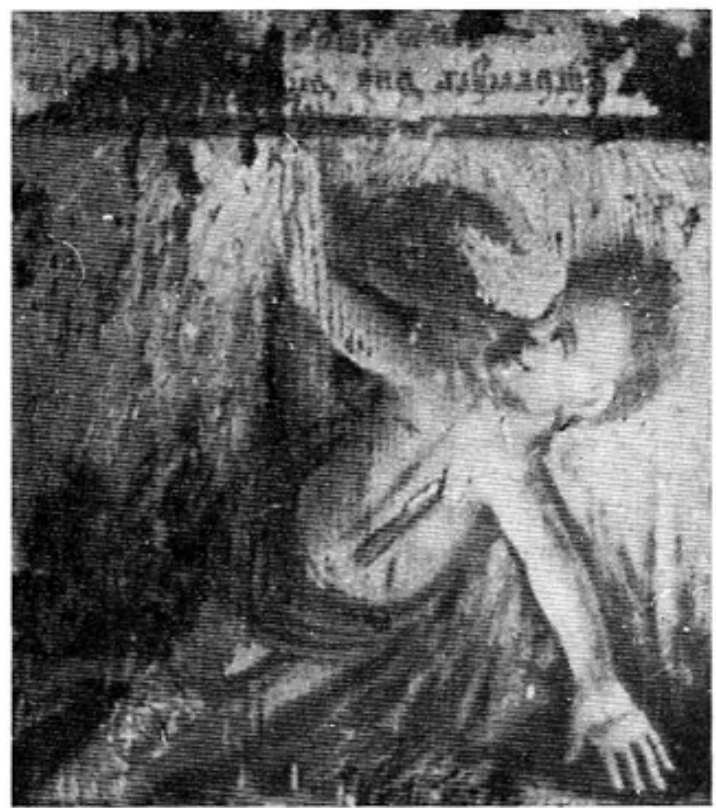
Abb. 4: Vierzehntes Bild des »Höllenbildes« in Niederbummel.