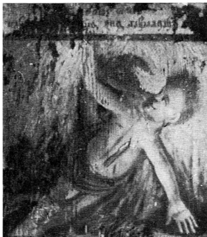
Abb. 4: Vierzehntes Bild des »Höllenspiegels« in Niederbummel.