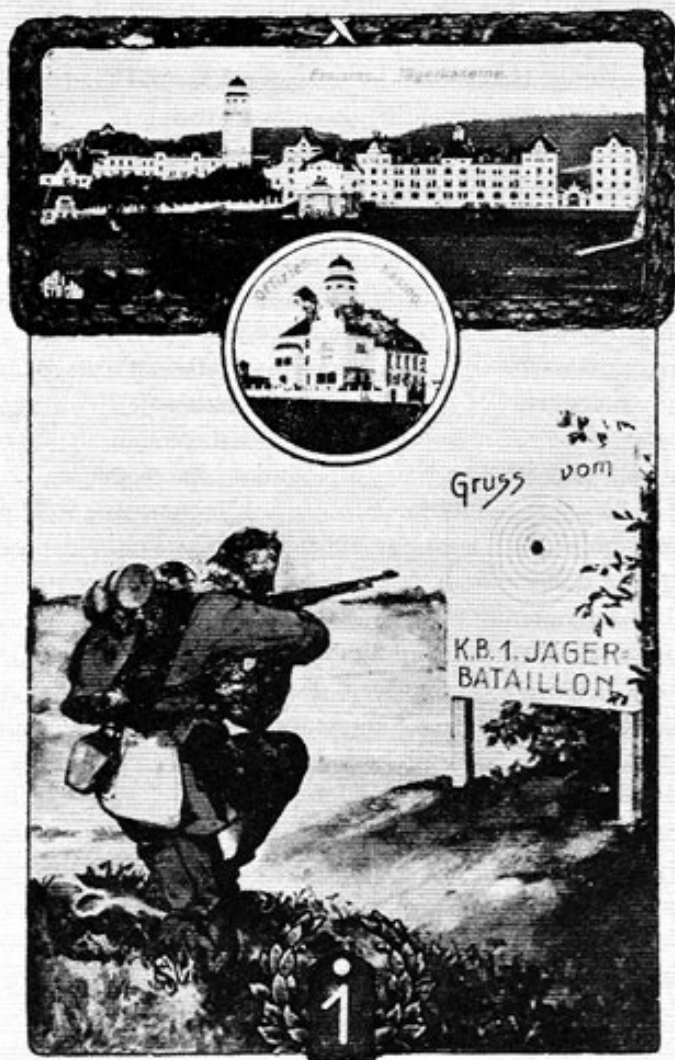
Abb. 4: Jägerkaserne, jetzige Vimykaserne in Freising zwischen 1906 und 1914.

kasino. Noch heute kann man an seinem Giebel die deutsche Bezeichnung »Offiziersspeiseanstalt« lesen.