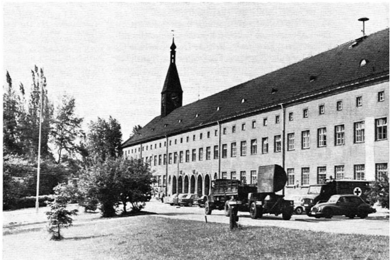
Abb. 5: General-von-Stein-Kaserne 1970.

1966: Übergabe der Kaserne an die Bundeswehr. Ab Mai Belegung durch die Standortverwaltung. Ab Juli 1966 bestand das »Détachement de coordination de la Defense aeriene francaise« aus einem Offizier (Capitaine Julien) und einem Unteroffizier. Ab Juli erfolgte die Belegung durch II./FmRgt 31 mit Stabskompanie, 7. und 8. Kompanie. Die II./Fernmelderegiment 31 betreibt das Control and Reporting Center (CRC) Freising im Rahmen des Radarflugmelde- und Leitdienstes der Luftverteidigung im Bereich der 4. ATAF. Mit Hilfe des halbautomatischen