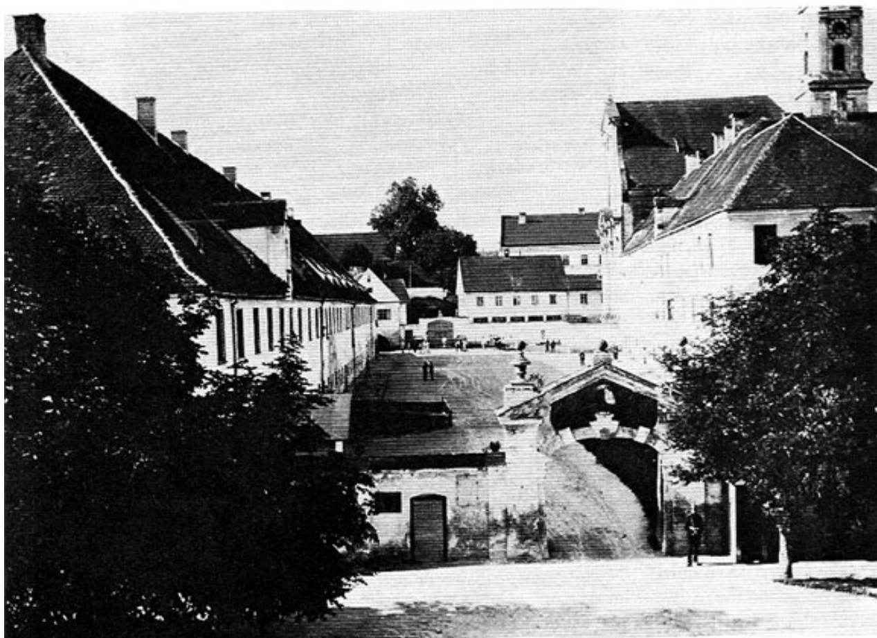
Abb. 3: Die Kaserne Neustift um das Jahr 1900.

Ab Mai 1919: Belegung mit Freiw. Jägerkompanie Mayer; im Juni mit dem III. Jägerbataillon des Schützenregimentes 41 mit Stab, 9. Kompanie und 12. Kompanie (MGK). Noch im Adreßbuch für Stadt und Bezirksamt Freising von 1920 wird die Kaserne als Jäger-Kaserne, Prinz-Arnulf-Straße 412½ bezeichnet. 1920 befand sich die Abwicklungsstelle des 1. Jägerbataillons im ehemaligen Offiziers-