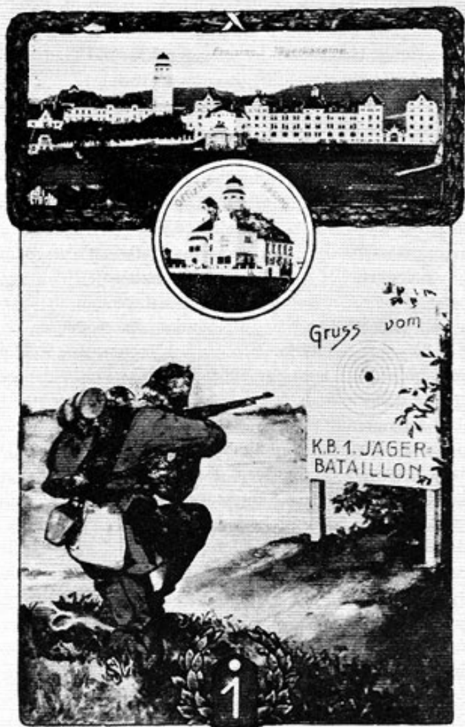
Abb. 4: Jägerkaserne, jetzige Vimykaserne in Freising zwischen 1906 und 1914.

kasino. Noch heute kann man an seinem Giebel die deutsche Bezeichnung »Offiziersspeiseanstalt« lesen.