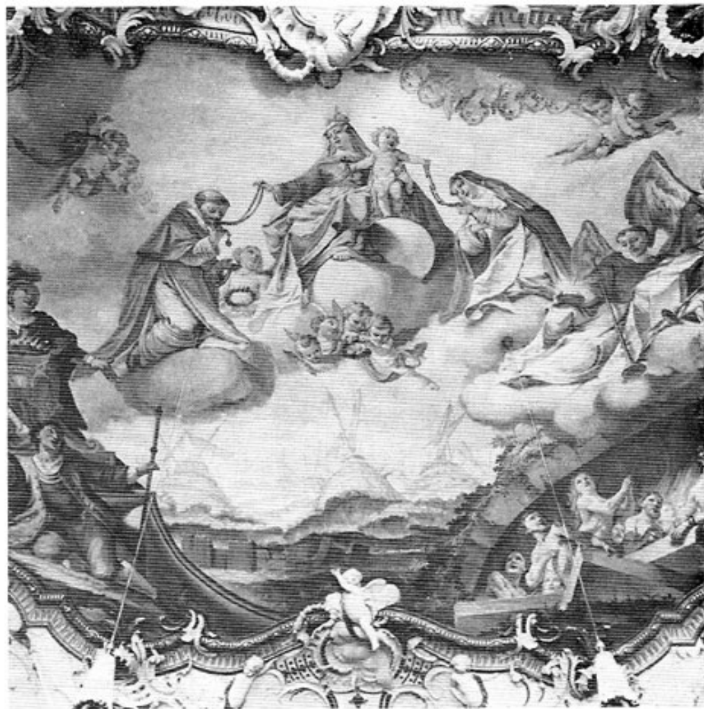
Die Muttergottes als Königin des Rosenkranzes von Matthäus Günther 1758 (33).