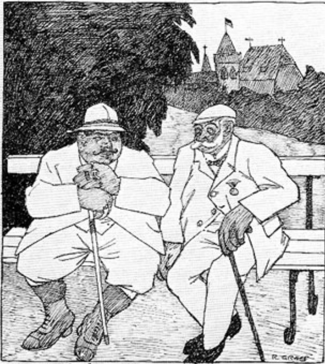
Abb. 4: Richard Graef: Unheilbar. Federzeichnung für den Simplizissimus, 34 x 30 cm. Besitzer: Heinz Groß, Dachau.

Unterschrift: »Wissens, Herr Oberscht, mir hat der Arzt gegen die Fettleibigkeit täglich a Dampfbad und drei Stunden Spazierengehn verordnet, aber seit dera Zeit iß i sechsmal so viel.«