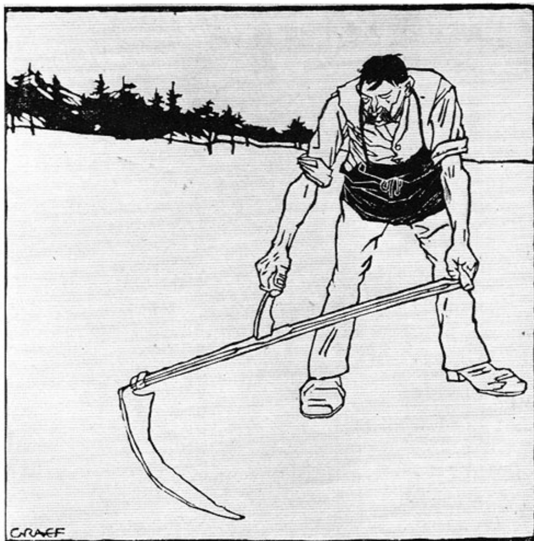
Abb. 2: Richard Graef: Schnitter. Holzschnitt, 39,7 x 39,5 cm.

Abbildung 1 gibt eines der wenigen Graef'schen Gemälde wieder. Ein im Aufbau sehr schönes, farblich feinabgestuftes Blumenstück. Aber abgesehen davon, daß Sabine Graef-Licht ähnliche Blumenstücke malte, gibt es inner-