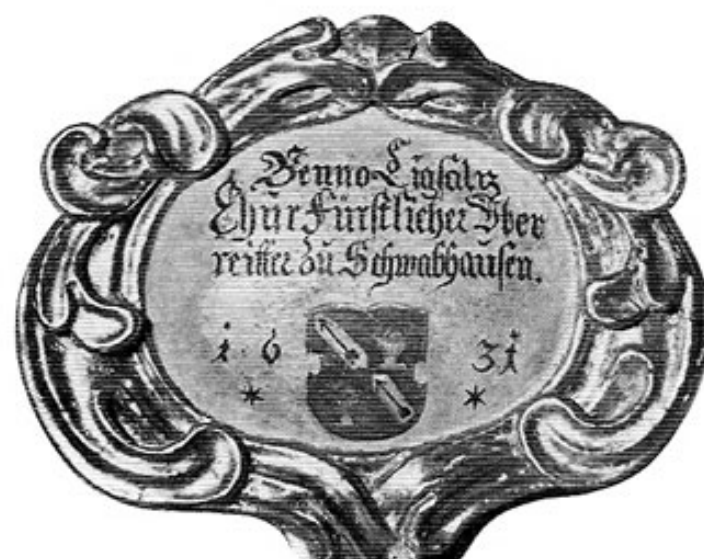
Widmungstafel an dem von Benno Ligsalz gestifteten Kruzifix mit dem alten Ligsalz wappen. Bei einer Renovierung wurde die ursprüngliche Jahreszahl 1681 in 1631 verändert.