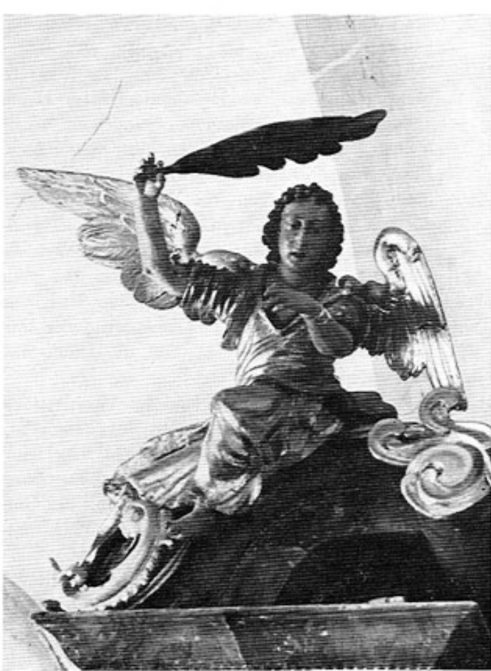
St. Martin in Amperpettenbach. Engel auf dem Hochaltar-aufsatz.