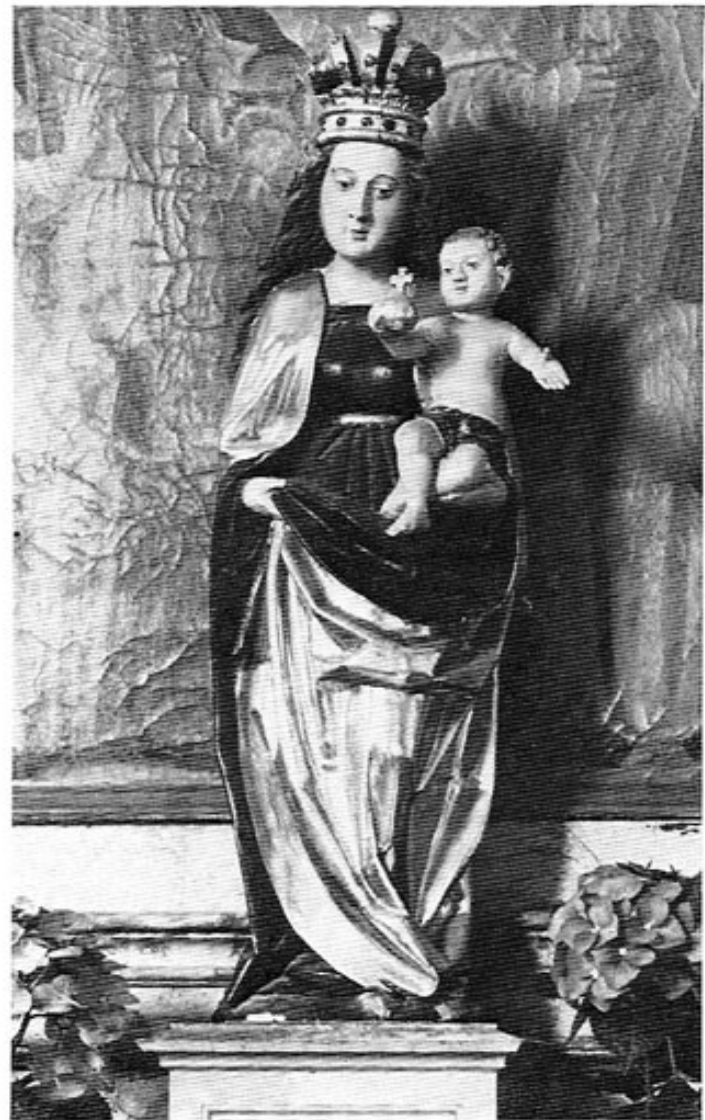
St. Martin in Amperpettenbach. Muttergottes (Ende des 15. Jahrhunderts) am rechten Seitenaltar, mit barocker Krone.