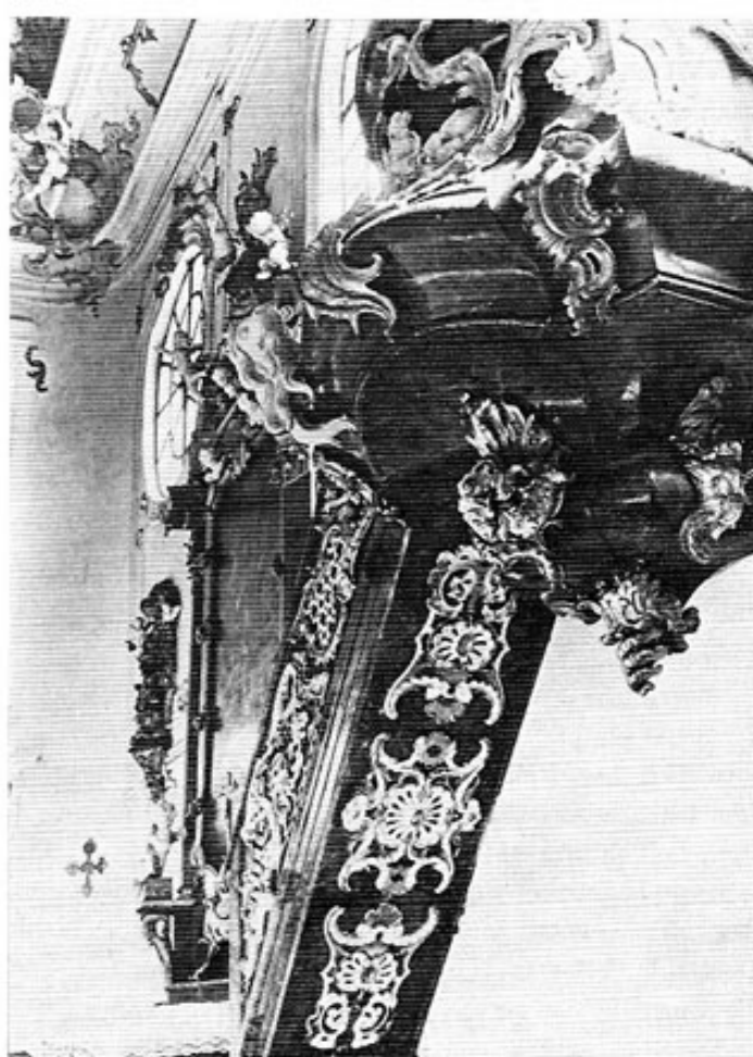
Schloßkapelle Haimhausen. Untersicht des Kanzelaufganges und des Kanzelkorpus.

Die Entwicklung der Bevölkerung brachte es mit sich, daß bereits seit dem Jahr 1972/73 wieder Schichtunterricht mit all seinen Nachteilen notwendig ist. Der Schulverband