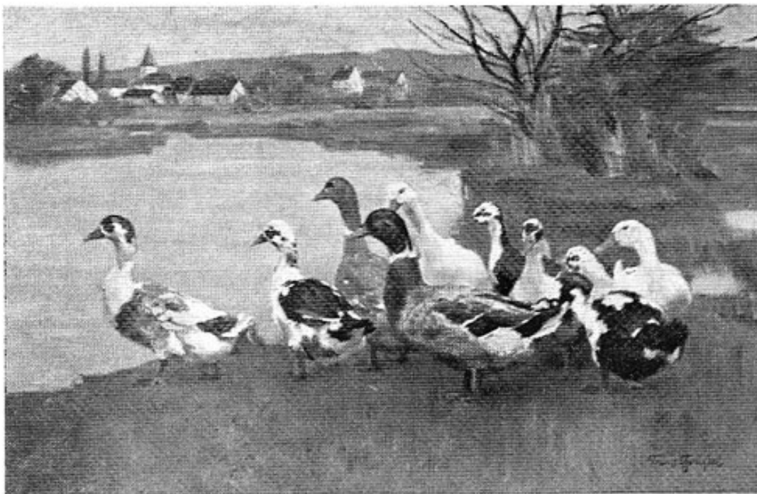
Abb. 7: Prof. Franz Gräfel: Enten (im Hintergrund Emmering). Öl. 81 x 51 cm.

Des Großstadtbetriebes überdrüssig, baute sich der Künstler 1900 im malerischen und friedlichen Emmering ein Haus (Emmeringer Straße Nr. 52), das er 1901 bezog. Noch heute leuchtet von dessen Giebel als Wahrzeichen des einstigen Hausherrn ein Bild mit schwimmenden weißen Enten. Er war gewissermaßen der Pionier des Emmeringer Villenviertels am einstigen Ammerlaich und gab den Anstoß dazu, daß sich bald auch andere Künstler in seiner Nachbarschaft niederließen. Eine geschlossene Künstlerkolonie, wie sie Gräfel vorgeschwebt hatte, kam jedoch nicht zustande. Noch im gleichen Jahr vermählte sich Franz Gräfel in Emmering mit Wilhelmine Auguste Lossow,