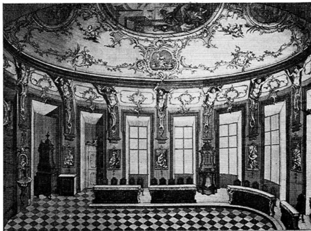
Das Indersdorfer Winterrefektorium. Kupferstich 1762.

Vier Englein geben das Motto: einer gießt Blumen, der andere bläst auf Blüten und Blättern: Vires reficiantur non opprimantur — nur soviel soll man essen, daß die Kräfte wiederhergestellt werden, nicht daß sie unterdrückt werden. Der Ruf zur Mäßigung spricht auch aus dem Spruchband der beiden anderen Putten, von denen eines ein Bierglas, das andere eine Medizinbüchse hält: Ad sobrietatem vel ad nauseam unum est necessarium — nur die Menge entscheidet, ob aus dem Genuß von Bier oder Medizin Erfrischung oder Übelkeit wächst.