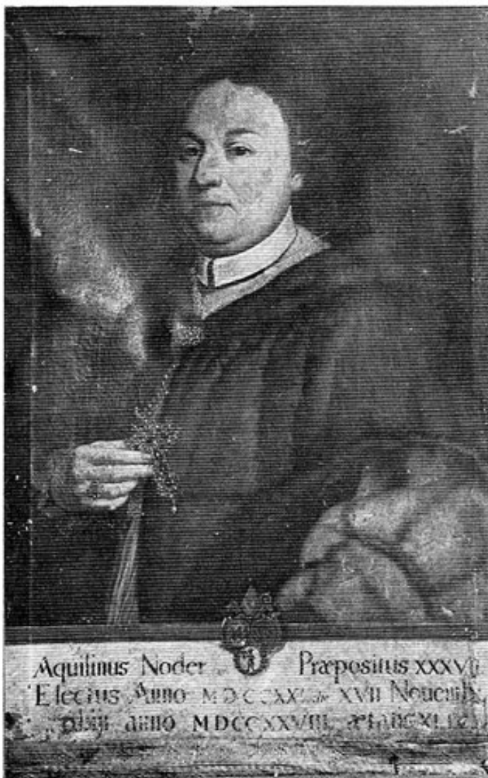
Propst Aquilin Noder (1721–1728).

hofen. Er war ein großer Gartenfachmann und setzte im Klostergarten neue Obstbäume. Außerdem ließ er ein gläsernes Gewächshaus bauen, über das sich bei einer Visitation 1740 einige Conventualen beschwerten 12 . 1741 Inthronisation der Reliquien der Heiligen Felix, Lucius, Faustus und Fortunatus. Große Mühe verwendete er auf die Bibliothek, die er mit neuen Kästen versah. Er gründete eine eigene Klosterdruckerei. In Langenpettenbach baute er zur Verbesserung der Seelsorge den Pfarrhof neu und exponierte dort zwei Chorherren. Außerdem Neubau des Pfarrhofs in Pipinsried und Erneuerung der Glonnbrücke. Sein Vorhaben, die Kapelle in der Rothschaige bei Dachau zu renovieren, hinterließ er seinem Nachfolger Gelasius, der es getreulich erfüllte 13 . Gestorben 1748.