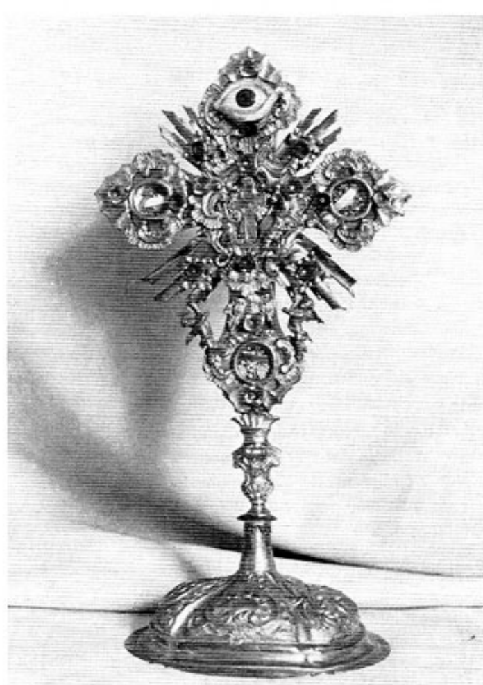
Monstranzartiges Reliquiar in der Straßbacher Kirche.