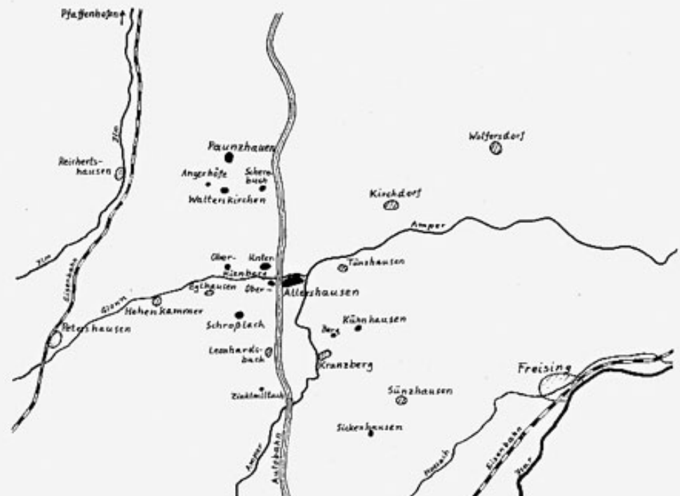
Skizze der Orte westlich von Freising, wo sich die Pfälzer Einwanderer zwischen 1820 und 1833 niedergelassen haben (die Orte sind schwarz markiert).