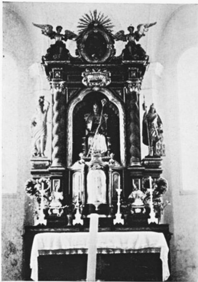
Abb. 2: Seit 1914 steht der ehemalige Sünzhausener Hochaltar in St. Maximilian bei Kraiburg am Inn.