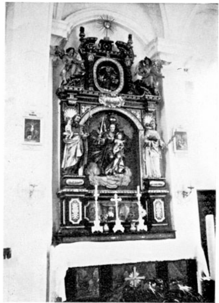
Abb. 4: Ehemaliger rechter Sünzhausener Seitenaltar, der seit 1914 in St. Maximilian bei Kraiburg am Inn aufgestellt ist.