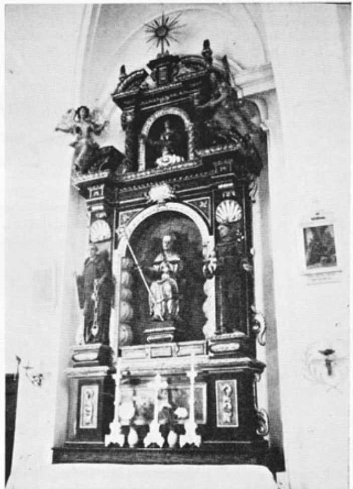
Abb. 3: Ehemaliger linker Sünzhausener Seitenaltar, der seit 1914 in St. Maximilian bei Kraiburg am Inn aufgestellt ist.