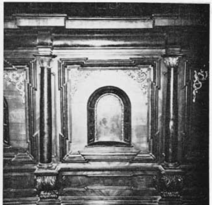
Abb. 5: Ausschnitte aus dem Chorgestühl in der Klosterkirche Fürstenfeldbruck.