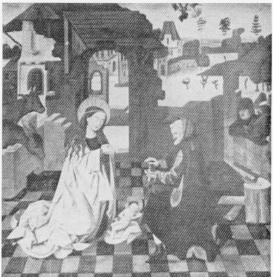
Abb. 4: Die Anbetung. Spätgotisches Gemälde in der Klosterkirche Fürstenfeldbruck. Öl, 100 x 100 cm.

gelinden Bemerkung veranlaßte, »an dem noch nicht völlig vollendeten Chorgestühl wird schon vierzehn Sommer gearbeitet und es wird mit Gold nicht gespart«. Wahrscheinlich bezog sich diese Rüge auf den breiten Blattfries an der oberen Kante des Gestühls, der ehemals nicht vorhanden war und einen besseren optischen Übergang von den strengen Renaissance-Formen zu den großen darüber hängenden Gemälden und den zierlichen Rokoko-Balkonen bewirken sollte (Abb. 3).