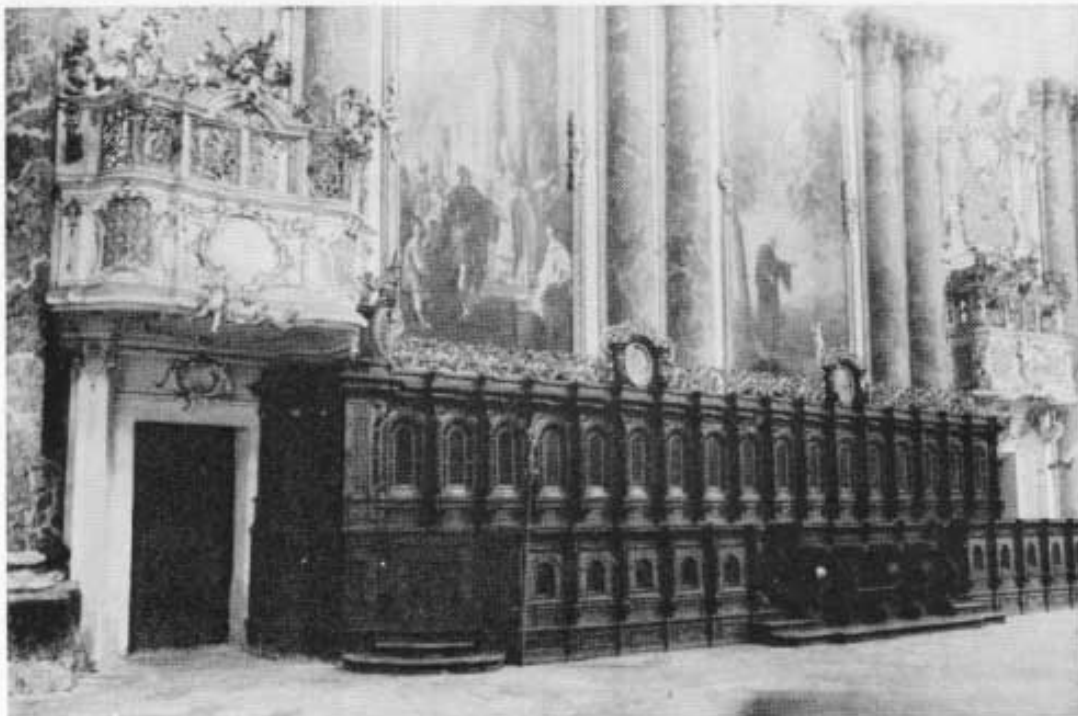
Abb. 3: Chorgestühl in der Klosterkirche Fürstenfeld.