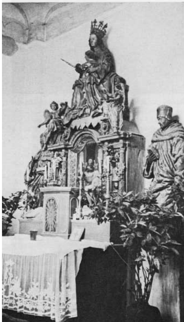
Abb. 1: Gesamtaufnahme des alten Hochaltars in seinem Zustand vor 30 Jahren.

Das hier erstmals veröffentlichte Bild über den Aufbau des Altars zeigt seinen Zustand vor 30 Jahren (Abb. 1). Eine zeitgenössische Handskizze dieses Altars bestätigt, daß wesentliche Veränderungen nicht vorgenommen wurden 6 .