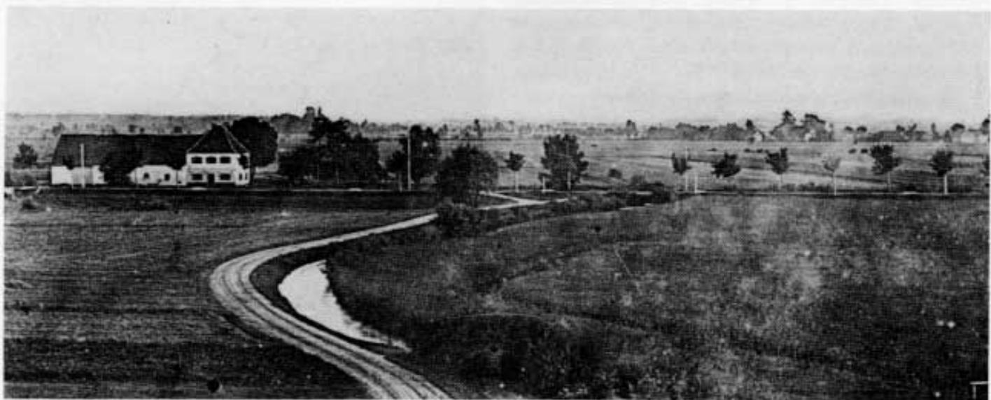
Abb. 1: Eine alte Fotografie zeigt die kleine Moosswaige mit Schleißheimer Straße und Pollnstraße um 1900.

Da stehen noch am Schleißheimer Kanal die beiden Moosswaigen. Die große ist durch Carl Olof und Elly Petersen in die Literatur eingegangen 1 . Leider steht sie vor dem Verfall, wie ein herrenloses Gut mit Löchern im Dach und zerbrochenen Fensterscheiben 2 . Der sogenannten kleinen Moosswaige etwas weiter stadtaus ist es besser ergangen. Auch sie ein Künstlerheim: Robert von Haug, Richard Graef und Paula Wimmer haben hier geschaffen. Freudlich leuchten die Mauern des alten Hauses. Noch liegt die