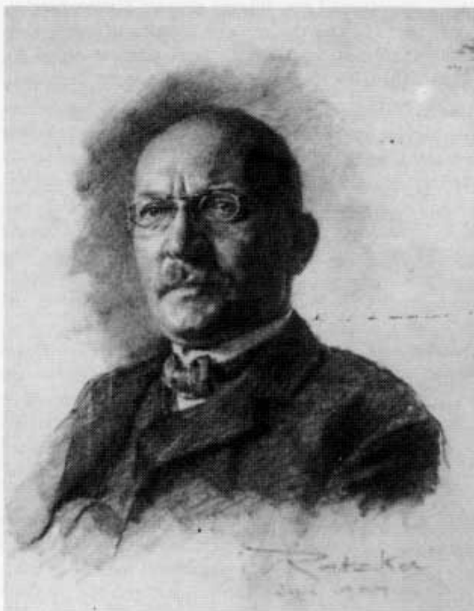
A. Ratzka: August Pfaltz. Koble auf Papier. Besitzer: Museumsverein Dachau.

Am 2. Februar 1908 wandte man sich abermals an das königliche Staatsministerium des Innern für Kirchen- und Schulangelegenheiten mit folgendem Wortlaut: »Der ehrfurchtvollst unterzeichnete Museumsverein Dachau erlaubt sich, ein Hohes Königliches Staatsministerium für Kirchen- und Schulangelegenheiten unterthänigst zu bitten, es wolle