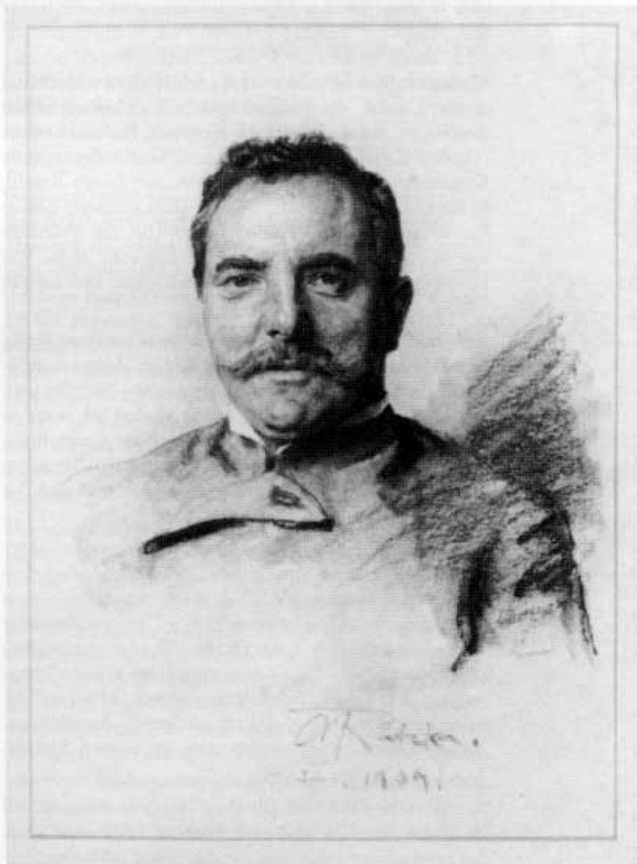
A. Ratzka: Hermann Stockmann. Koble auf Papier. Besitzer: Museumsverein Dachau.