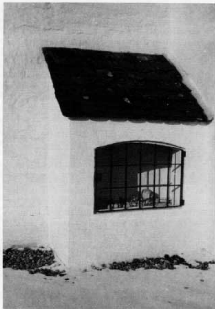
Der Totenkerker an der Kirche von Piedendorf.

Bei der Renovierung der Kirche machten die Handwerker noch einen bedeutenden Fund: In einer freigelegten Mauernische fanden sie vier romanische Figuren, die vermutlich aus dem 13. oder 14. Jahrhundert stammen. Es