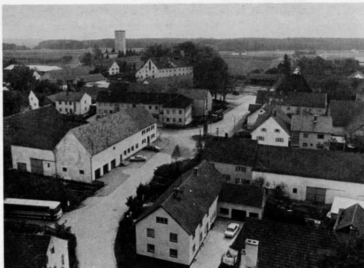
Ortsbild von Vierkirchen mit Blick zum Wasserturm.

Aber bald darauf versuchte eine Adelssippe sich dieser Martinskirche zu bemächtigen. Es scheint, daß die sog. »Mohingara«, d. h. die Mochinger, die Besitzansprüche auf die St.-Martins-Kirche zu Biberbach erhoben und diese Kirche innerhalb der Familie vererben wollten, irgendwie mit deren Gründung oder Ausstattung zu tun hatten, sonst hätten sie kaum so hartnäckig sein können, bis zwischen 806 und 808 ein öffentliches Gericht unter Aufsicht