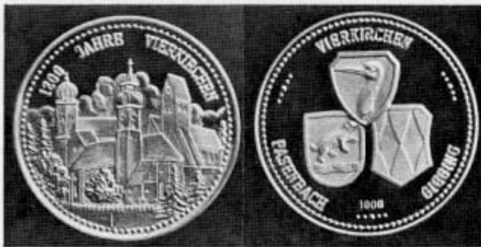
Vorderseite Rückseite 26 mm Ø — Silber —

Wie hier in Biberbach der Bischof über die ehemaligen Eigenkirchenherren siegte, so auch im Falle der Erlöserkirche zu Vierkirchen. Davon haben wir bereits gehört.