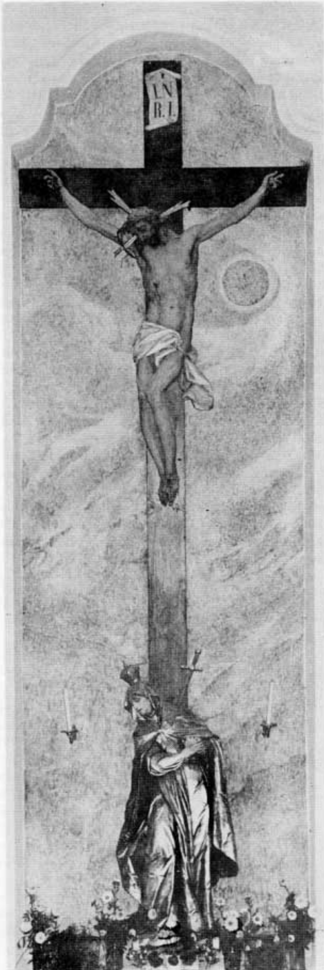
Mater dolorosa von Ignaz Günther in der Pfarrkirche St. Jakob in Vierkirchen.