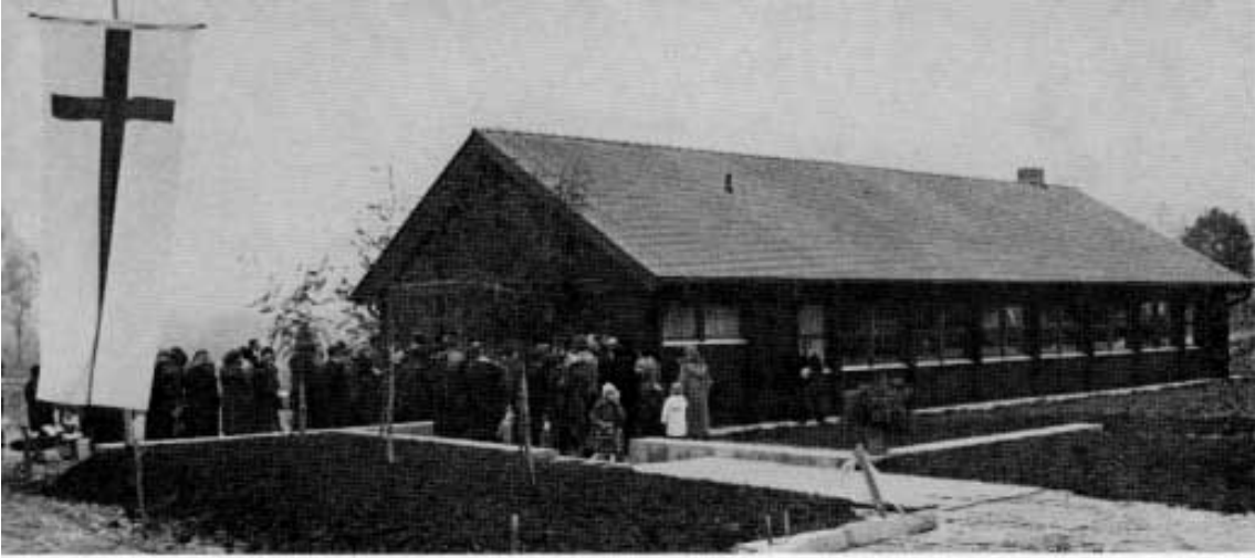
Eröffnungsfeier des evangelischen Pfarrheimes in Esterhofen November 1978.