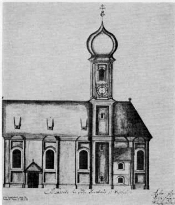
Pfarrkirche Vierkirchen. Südansicht, Aufriß von Anton Glonner 1753/54. Staatsarchiv Landshut Rep. 76, Verz. 6, Fasz. 7, Nr. 276.

Grabplatten der Hofmarksherren von Barth von 1491 bis 1758 wurden bei der Renovierung vom Boden an die Kircheninnenwand verlegt; Priestergräber sind aus den Jahren 1695, 1709 und 1789 vorhanden.