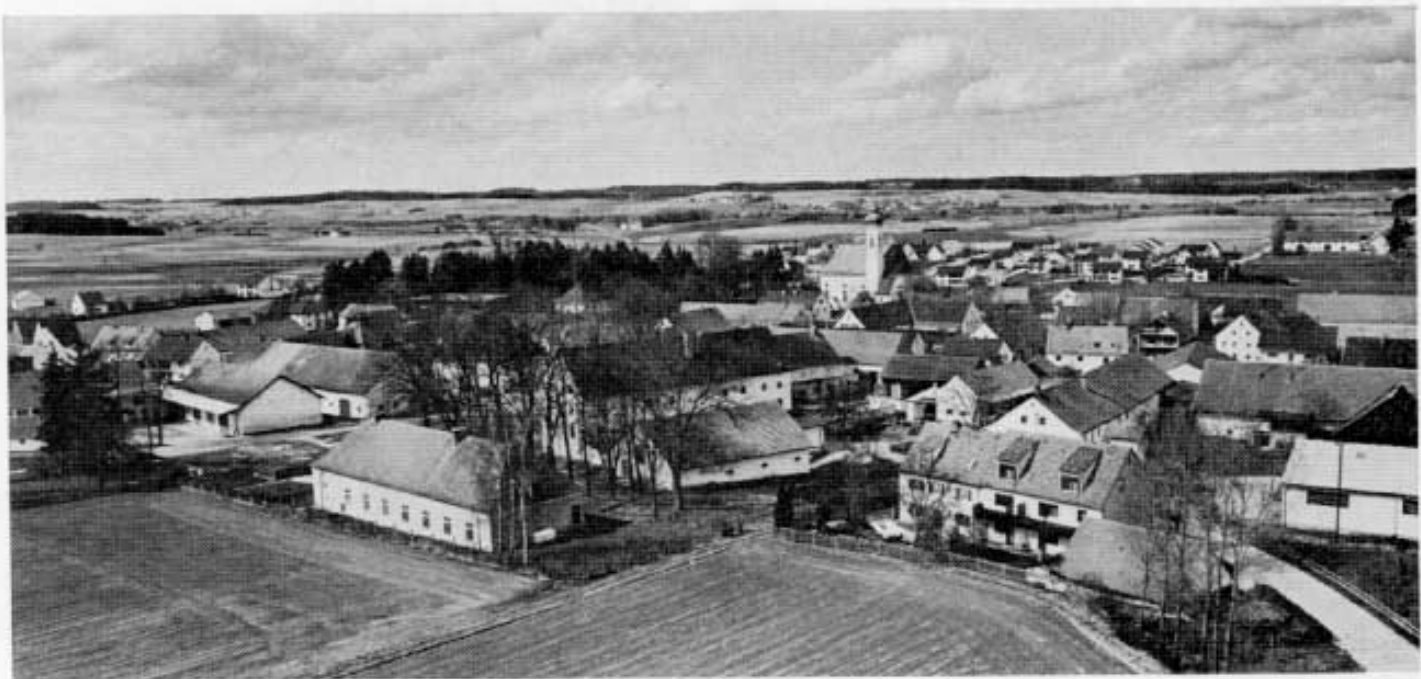
Ortsbild von Vierkirchen, vom Wasserturm zum Glonnal zu gesehen.