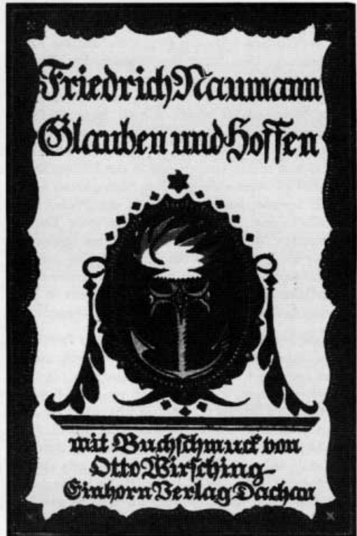
Abb. 1: Otto Wirsching: Buchschmuck zu Friedrich Naumanns »Glauben und Hoffen« (Holzschnitt).