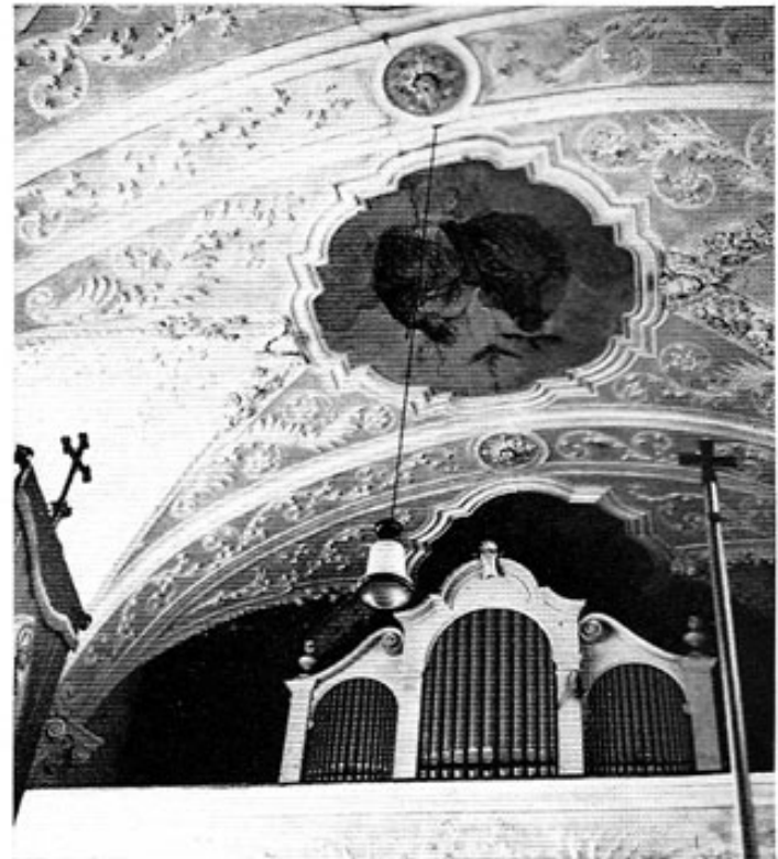
Attaching, rückwärtiger Teil des Langhausgewölbes.

Nah der südöstlichen Stadtgrenze steht das kleine, 1718 geweihte, äußerlich so anspruchslose Gotteshaus St. Erhard, dessen Turm von einem pyramidenförmigen Spitzdach abgeschlossen ist. Beim Betreten des Raumes bietet sich eine Stukkatur, die man nicht erwartet hätte; die in zartem Rosa, Gelb und Blau getönten Grundflächen tragen eine Fülle reicher Zierformen. Sowohl den Gewölbekanten im Chor als denen der in die Segmenttonne des Langhauses einschneidenden Stichkappen entlang ziehen sich Schnüre aus Blumenkelchen, die nach oben in kurze Gebinde übergehen und, wo immer die Linien die Bild- oder Medaillonrahmen erreichen, von geflügel-