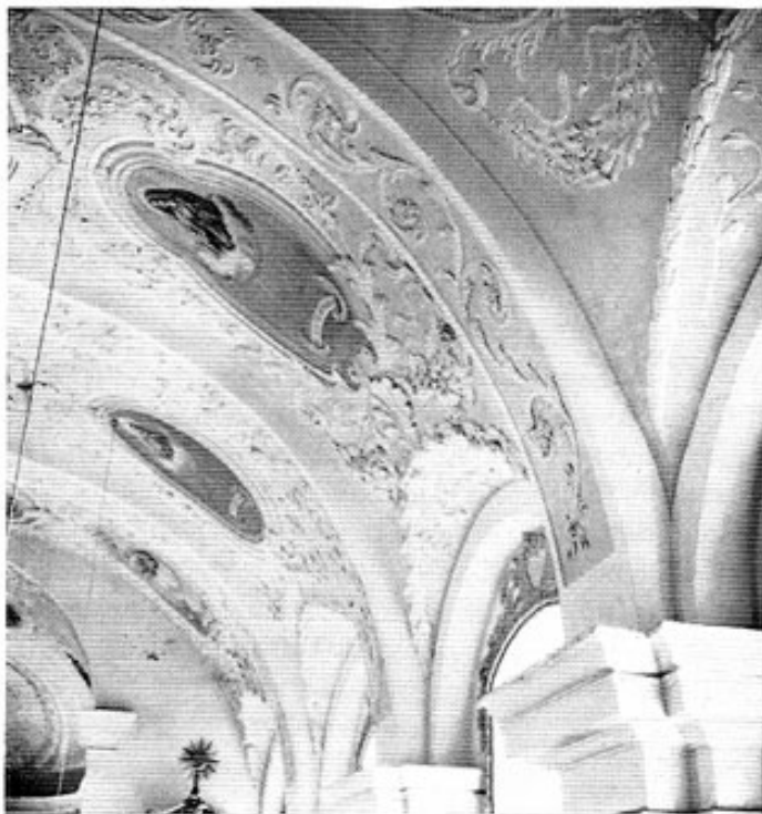
Kirchdorf/Amper, Fensterpartie.

Beim Betreten des hohen durchlichteten Schiffs fällt der Blick zuerst flüchtig auf die Altäre, wandert dann die Pilaster entlang, richtet sich darnach aber unwillkürlich in die Höhe zum Schmuck der Gewölbe. Vornehm nimmt sich die Stuckfiguration auf Altrosa und grauer Grundierung aus und man vermeint sie anders zu empfinden