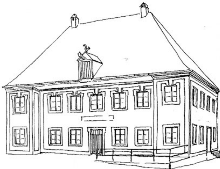
Wirt in Maisteig

Die Mühlen sind als weitere bäuerliche Unternehmen zu nennen. Als einziges noch erhaltenes Beispiel eines hübschen Barockbaues, ebenfalls mit giebelseitigem Eingang, ist hier die Mühle zu Asbach anzuführen. Sie wird schon um 1140 genannt als sie durch das Kloster Benediktbeuern dem Kloster Indersdorf übergeben wurde. 1694/95 wird der Ort als Hofmark des Klosters Indersdorf bestätigt und bleibt mit der Mühle, deren jetziger Bau um 1700 entstand, bis zu dessen Säkularisierung 1783 in dessen Besitz.