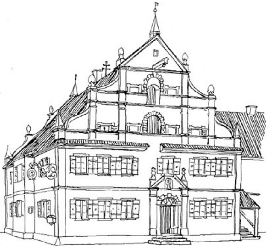
Wirt in Petershausen.

Als letztes der schönen alten Landgasthäuser sei Mai- steig vorgestellt. Auch hier bestand der Ort früher nur