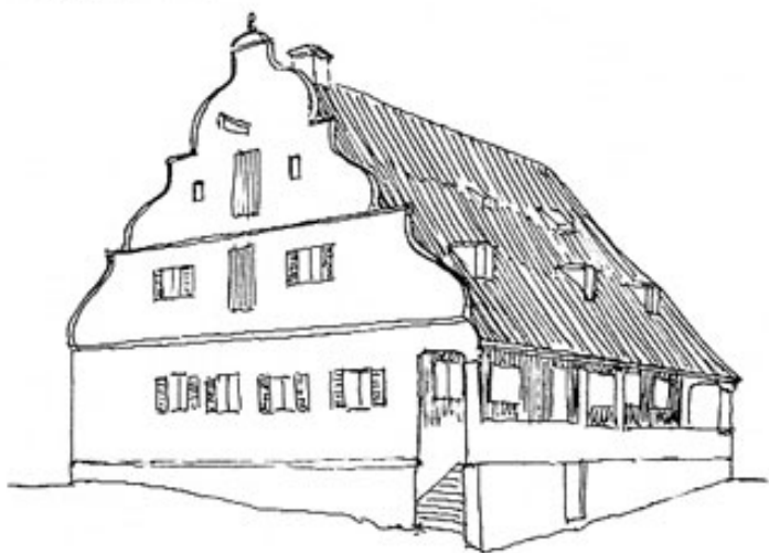
Schmied in Amperpettenbach.

Zeichnung: Architekt Gruber, Bergkirchen