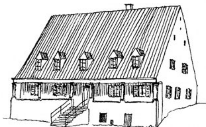
Welschhof in Etzenhausen.

Architekt Max Gruber, 8061 Bergkirchen 55.