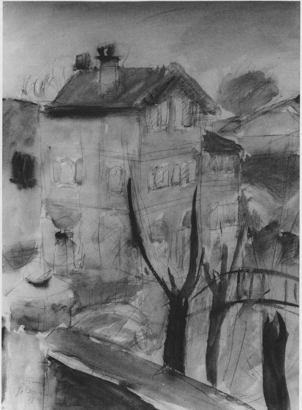
Jorgo Busianis: Haus mit Garten, Paris 1931, Aquarell 63,5 × 48 cm (Privatbesitz).

Das Haus gehört jetzt der Stadt Athen, sie ließ es restaurieren und unter Denkmalschutz stellen. Die Straße trägt jetzt Busianis' Namen. Das ist heute. Damals begann für Busianis eine neue Notzeit, die ihm, weil sie mit einer besonders schweren seelischen Enttäuschung verbun-