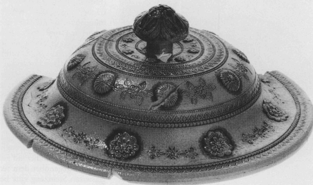
Abb. 5: Deckel für ein Bowlengefäß. Größter Durchmesser 25 cm.

Deckel für Bowlengefäße. – Insgesamt liegen mehr oder weniger vollständige Fragmente von sechs stattlichen Deckeln vor, die ihrer Funktion nach als Steckdeckel zu bezeichnen sind. Ihr größter Durchmesser beträgt 25 cm. Sie waren für Punsch- oder Bowlengefäße bestimmt, wie ihre Aussparungen für die Schöpflöffel erkennen lassen. Sie sind mit Dekoren der verschiedensten Art geradezu überladen. Ein Teil dieser Deckel weist eine hochgezogene, breit gerundete Schulter auf (Abb. 5). Es wurden aber auch bedeutend flachere Dekelformen angetroffen. In der Mitte beobachtet man