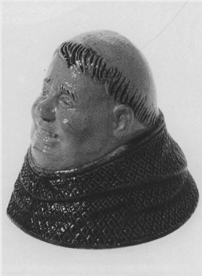
Abb. 4: Deckel eines Mönchskruges. Kleidung violett, Haarkranz braun. H 6,5 cm.

(1979) nannte diese Krüge »character steins«. Fragmente von Mönchskrügen stimmen mit der Kat.-Nr. 197 in Hagn und Endres (1990) vollkommen überein. Neu sind allerdings einige wenige Bruchstücke, deren Oberfläche eher federartig verziert ist. Auch die weibliche Figur (Kat.-Nr. 203 und 204 in Hagn und Endres 1990) ist im Fundgut von Freising II vertreten, desgleichen der Feder-