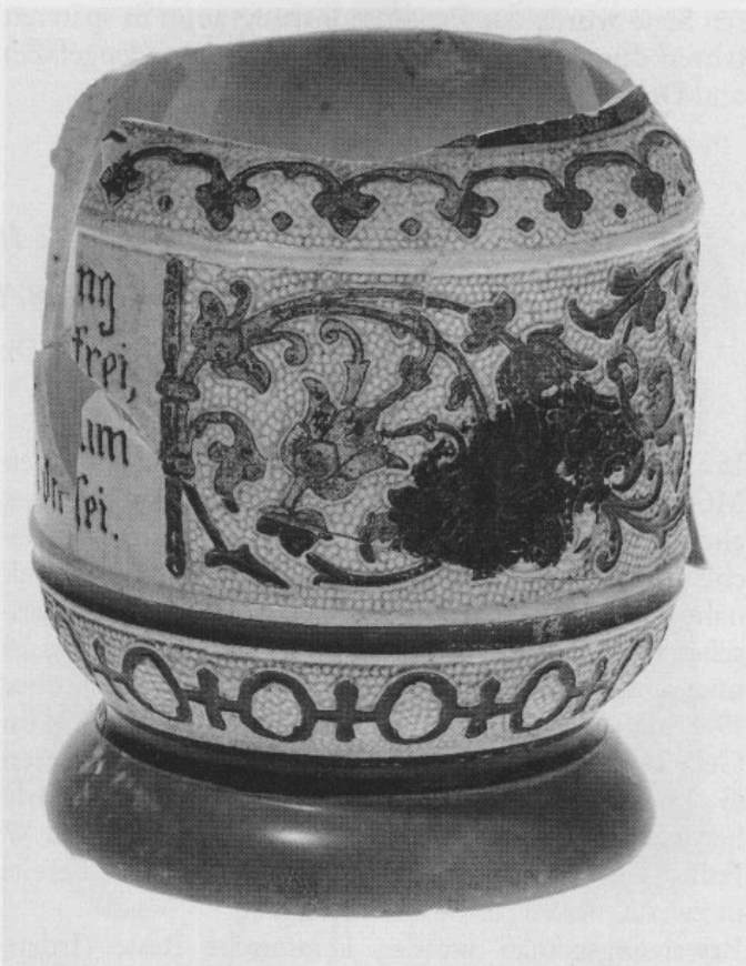
Abb. 11: Porzellankrug mit zylindrischem Mittelfries. Höhe fragmentär 10,5 cm.

Die auf zwei Böden von Krügen aus Elfenbeinsteinzeug bzw. Porzellan angebrachten Stempel »Germany« bzw. »Made in Germany« weisen auf eine Zeit nach 1887 hin, da in diesem Jahr die Merchandise Marks Act Wirksamkeit erlangte. Eine mittels einer Strangpresse hergestellte Mineralwasserflasche läßt als zeitliche Untergrenze das Jahr 1879 erscheinen.