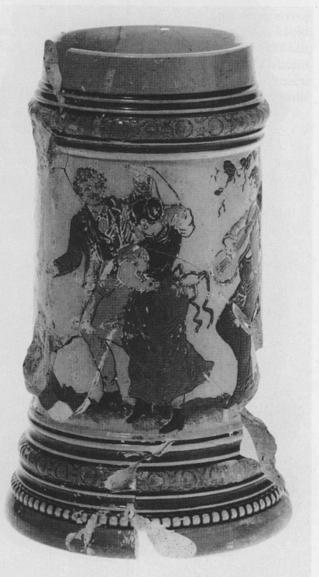
Abb. 9: Polychrom bemalter Krug aus Elfenbeinsteinzeug mit Szene aus Biergarten. H 18,3 cm.