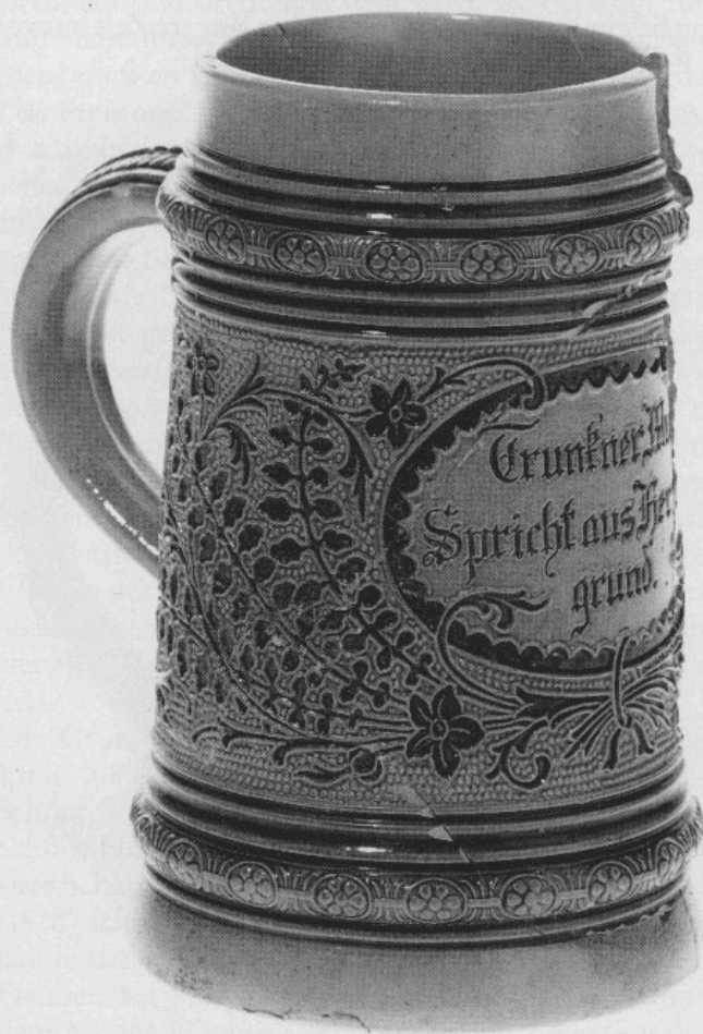
Abb. 3: Mittelgroßer zylindrischer Krug mit floralem Dekor und Spruch in Kartusche. H 14,1 cm.

Ein dritter, etwas gedrungenerer Krug (H 12,8 cm) läßt auf der Vorderseite eine gezackte Kartusche mit dem nur fragmentär erhaltenen Spruch »Viel . . . er k . . . jeder Hahn, So er die Kehle feuchtet an« erkennen. Auf beiden Seiten der Kartusche erscheint ein stark abstrahierter floraler Dekor mit Ranken- und Blattwerk, der geradezu modern anmutet. Der Mittelfries wird von breiten Rillen