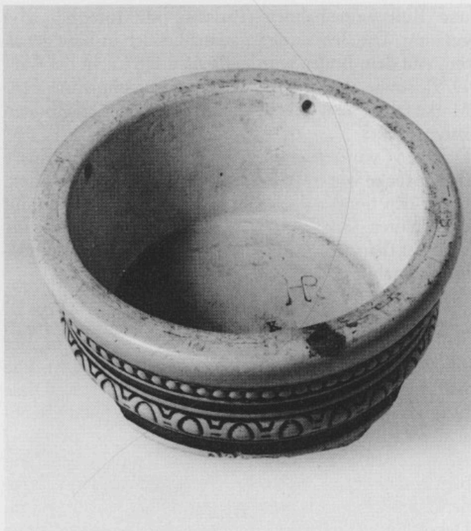
Abb. 1: Bodenstück eines Kruges aus Elfenbeinsteinzeug mit HR-Markel (Nr. 450). Ø 11,2 cm.

Baustelle den gröbsten Schutt beseitigen zu können. Dabei mußte auch eine in jüngerer Zeit aufgebrachte Betondecke weitgehend beseitigt werden. In unmittelbarer Nähe zum Haus Nr. 28, dem früheren Stammsitz der Firma Hauber & Reuther, gelang es nun, eine nur wenige Quadratmeter große, wenig tiefe Abfallgrube zu entdecken, die eine große Zahl von keramischen Fragmenten enthielt. Neben Bruchstücken von Gefäßen der verschiedensten Art wurden auch reichlich Brennhilfsmittel angetroffen. Die Funddichte war erfreulich groß, die keramischen Bruchstücke schienen allenfalls nur geringfügig verlagert. HR-Marken wurden mehrfach beobachtet (Abb. 1). Obwohl die Ausbeute in einem großen Kunststoffcontainer untergebracht werden konnte und von der Quantität her somit nicht gerade überwältigend war, schien doch die Qualität des Fundes sehr hoch zu sein. Dies bewiesen auch die anschließenden restauratorischen Arbeiten, da nicht wenige Gefäße wieder weitgehend zusammengesetzt werden konnten. Außerdem zeigte sich, daß das Fundgut neben dem »konventionellen« salzglasierten Steinzeug auch Elfenbeinsteinzeug und selbst Porzellan enthielt. Im folgenden wird der Inhalt dieser Grube als Freising II geführt.