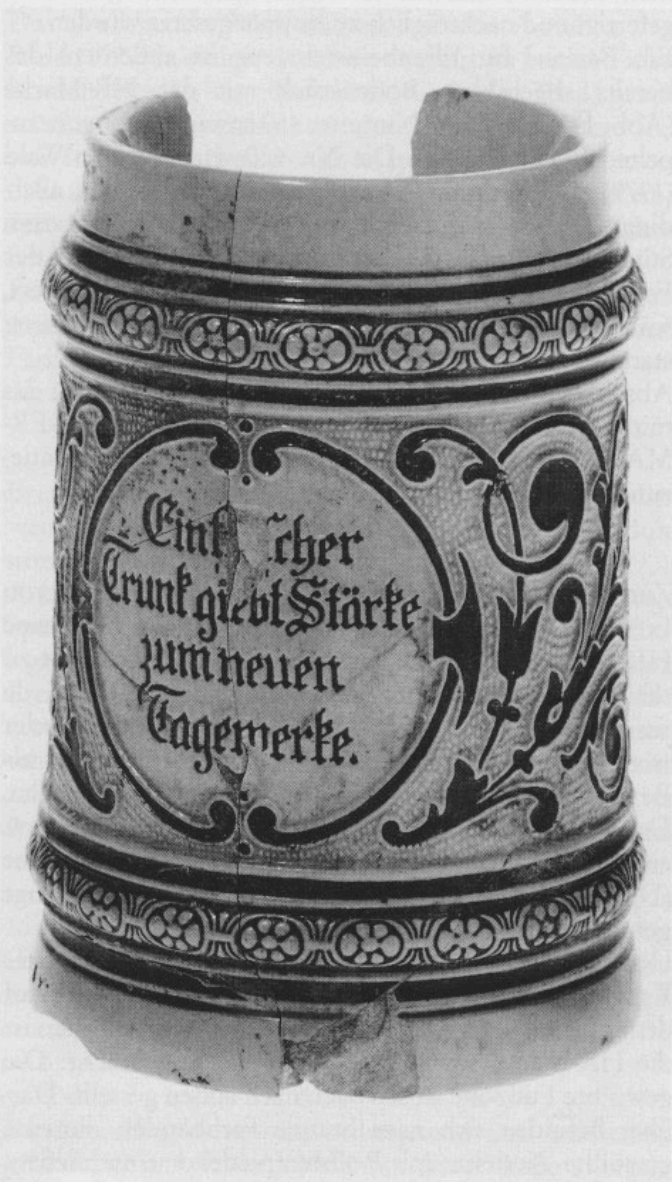
Abb. 8: Zylindrischer Krug aus Elfenbeinsteinzeug. H 13,6 cm.

Kommen wir nun zu einigen Beispielen. Abb. 8 zeigt einen zylindrischen Halbliterkrug aus Elfenbeinsteinzeug. Auf der Bodenunterseite sind die HR-Marke sowie die Nr. 236 (nicht bei Wald 1979) sichtbar. Auf der henkelabgewandten Seite beobachtet man eine aus zwei Halbbögen bestehende Kartusche, die den Spruch »Ein frischer Trunk giebt Stärke zum neuen Tagewerke« ein-