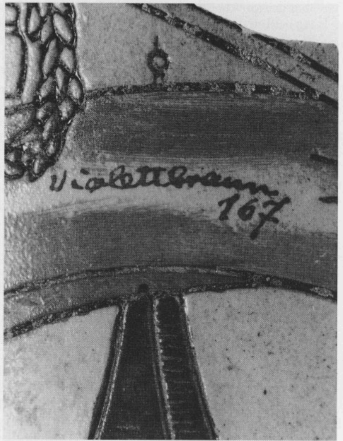
Abb. 7: Wandstück mit nachträglich aufgebracht Farbe und Farbbezeichnung. Größte Höhe 3,8 cm.

stücke bisher nicht rekonstruiert werden konnten. Auch sie sind überwiegend mit floralem Dekor (u. a. Weinlaub und Ranken) versehen. Daneben wurden Rollstempeldekorationen der verschiedensten Art beobachtet. Außer Stichdekorationen (auch in Freising I) wurden ferner aufgelegte Rosetten (teilweise mehrfach gefüllt und mit Kreuz in der Mitte) sowie Löwenköpfchen festgestellt. Auch Friese mit Beschlagwerk und Masken fehlen nicht.