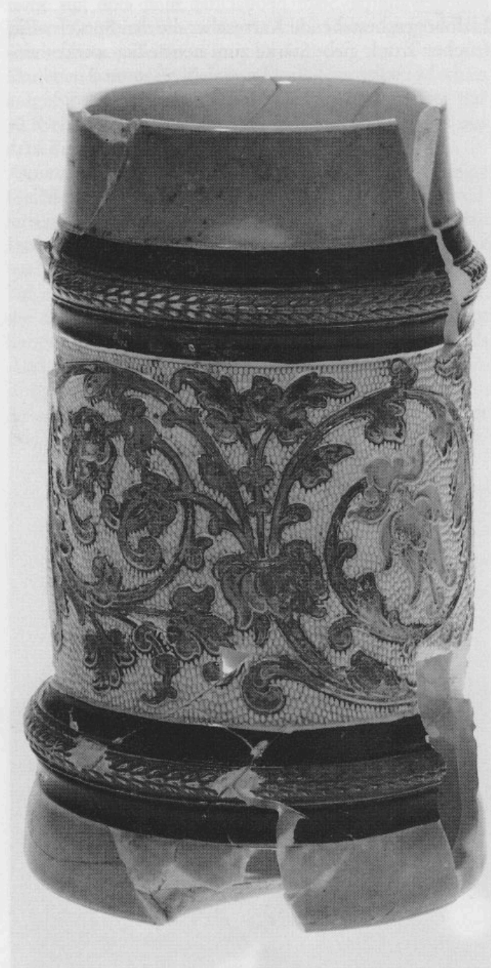
Abb. 10: Zylindrischer Porzellankrug. H 17,8 cm.

Ein weiterer Halbliterkrug erscheint nur deshalb so hoch und schlank, weil er auf einem extrem hohen Standring bzw. Hohlfuß ruht. Auf der Bodenunterseite beobachtet man neben der HR-Marke die Nummer 183 sowie den gestempelten Buchstaben M. Der polychrom ausgeführte Mittelfries zeigt von links nach rechts ein tanzendes Paar, einen Gitarrenspieler (Abb. 9) sowie eine nur fragmentär erhaltene Szene am Biertisch, die bereits eine vorgerückte Stunde anzeigt. Über und unter dem Bildträger sind Rillen und Zierleisten mit Rollstempeldekor angebracht. Die häufigsten Farben sind Grau, Gelb,