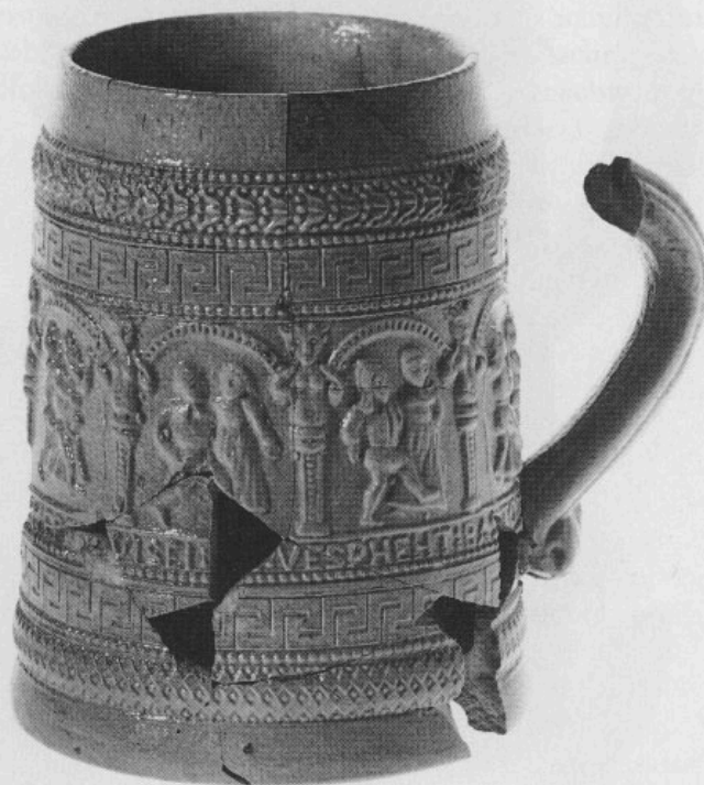
Abb. 2: Kleiner zylindrischer Krug mit »Bauerntanzen«. H 10,6 cm.

Kleinstückige Fragmente mit dem Motiv des »Bauerntanzes« wurden auch in Freising I nicht selten angetroffen (Kat.-Nr. 194 und 194 a in Hagn und Endres 1990). Der vorliegende Krug gibt Aufschluß über die Reihenfolge der beteiligten Paare, zeigt aber auch, daß in Freising bestimmte Ausformungen über längere Zeit hinweg in Produktion standen.