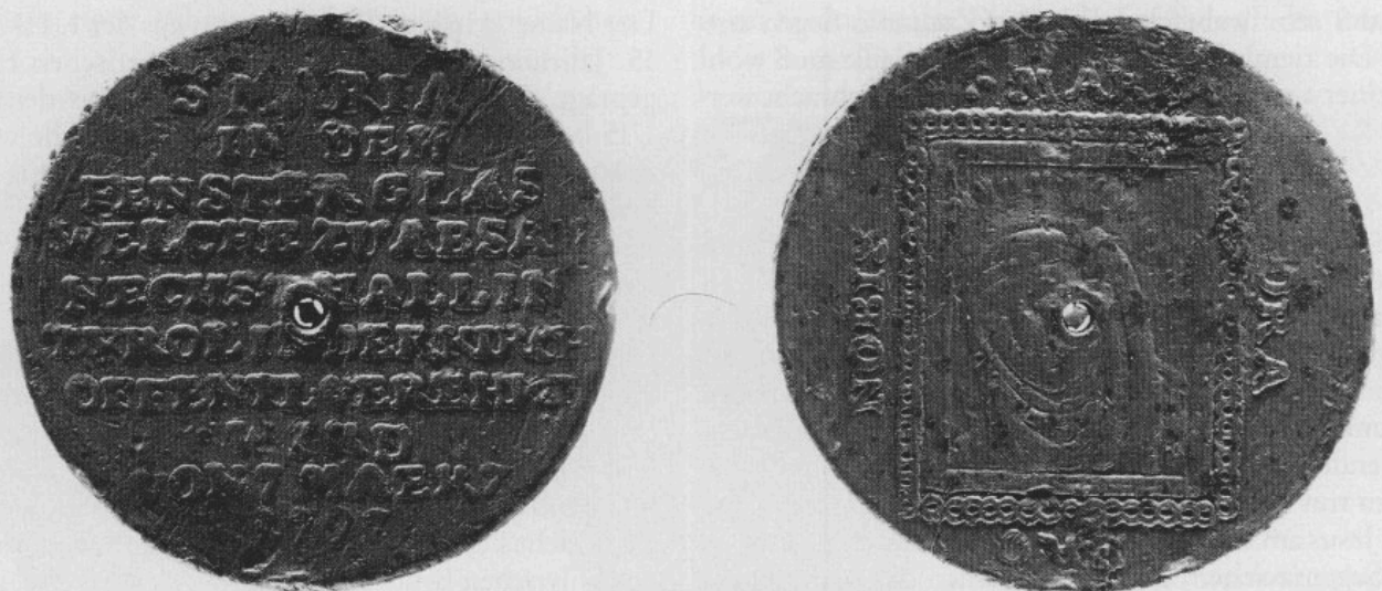
Abb. 6: Medaille von Absam in Tirol. Links die Rückseite mit Beschriftung, rechts Vorderseite der Medaille mit Gnadenbild.

Da Tirol von Ende 1805 bis 1814 unter bayerischer Verwaltung stand und das Unterinntal 1809 wiederholt unter Deroy und Wrede von bayerischen Truppen besetzt war, könnte die vorliegende Medaille durch einen Beamten oder Soldaten nach München gebracht worden sein.