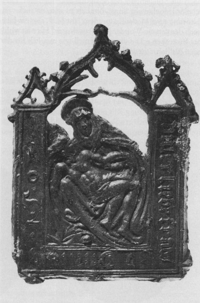
Abb. 1: Plakette von Dettelbach am Main, datiert 1507.

Die vorliegende, im oberen Teil etwas verbogene Plakette ist 6,3 cm hoch und 4,3 cm breit. Sie liegt als einseitiger Guß aus Zinn vor, dem möglicherweise etwas Blei beige-