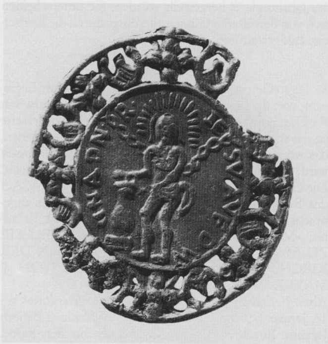
Abb. 4: Beidseitig ausgeführter Gitterguß. Vorderseite der Medaille mit dem Heiland in der Wies.