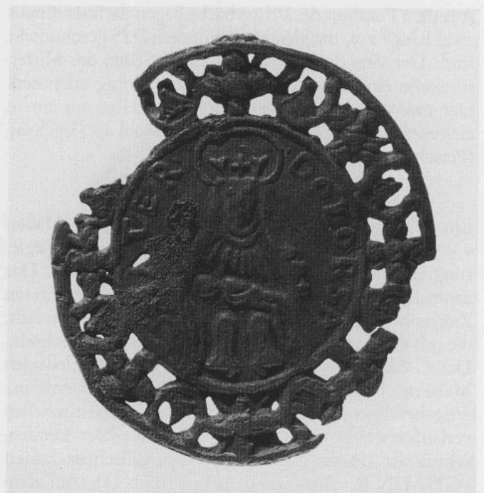
Abb. 5: Rückseite der in Gitterguß gearbeiteten Medaille mit der Mater dolorosa.

kranzanhänger und Medaillen mit der Umschrift »BEATA MARIA OETINGENSIS« bzw. »OETHINGENSI« aus dem frühen 18. Jahrhundert erwähnt. 10 Die vorliegende Medaille dürfte daher in die 2. Hälfte des 17. Jahrhunderts zu stellen sein.