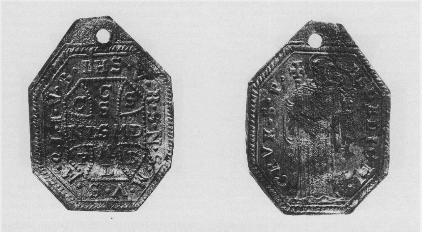
Abb. 7: Achteckige Benediktus-Medaille.

Eine ähnliche Medaille wurde unlängst 18 vom Bergbauernhof Untererlbach, Gde. Alpbach, in Nordtirol beschrieben. Sie besteht allerdings aus Buntmetall, ist rundoval und besitzt eine randliche Öse. Sie stellt daher eine Variante zu unserem Stück dar.