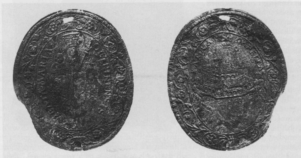
Abb. 2: Doppelseitig geprägte Medaille von Altötting. Auf der Vorderseite das Gnadenbild, auf der Rückseite die Heilige Kapelle.

Die Medaille wurde lose im Aushub des Pfisterbachs gefunden. Für ihre Datierung ist die Marke PS wichtig, da sie auf Peter oder Paul Seel hindeutet, die im 17. Jahrhundert in Salzburg als Stempelschneider tätig waren. 8 Im einschlägigen Schrifttum wurden entsprechende oder zumindest ähnliche Medaillen aus den Jahren 1655 bzw. 1658 beschrieben. 9 In diesem Zusammenhang seien auch die im Stadtmuseum Deggendorf aufbewahrten Rosen-