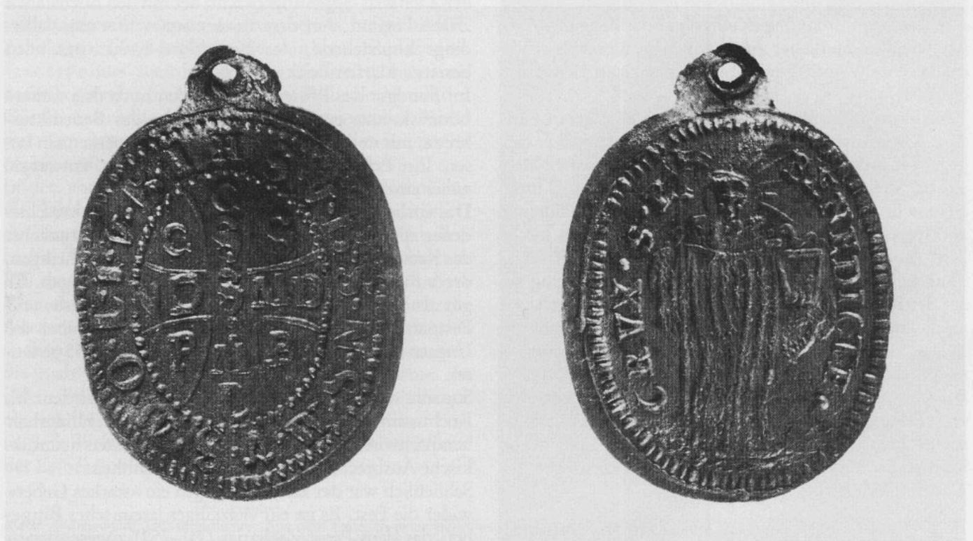
Abb. 8: Ovale Benediktus-Medaille.

Kupferlegierung, die an der Oberfläche stellenweise schwarze, unlösliche Beläge aufweist. Die Medaille ist mit einer Kerbleiste verziert. Unter dem Loch ist ein IHS zu erkennen. Von rechts oben nach links oben verläuft eine Reihe von Buchstaben, die durch Punkte voneinander getrennt werden. Die Reihenfolge ist: »V.R.S.N.S. M.V.S.M.Q.L.I.V.B.«. Auf dem Längsbalken des Kreuzes sind die Buchstaben CSSML angebracht. Der Querbalken trägt hingegen die Buchstaben NDSMD. In den vier Zwickeln des Kreuzes beobachtet man ferner die