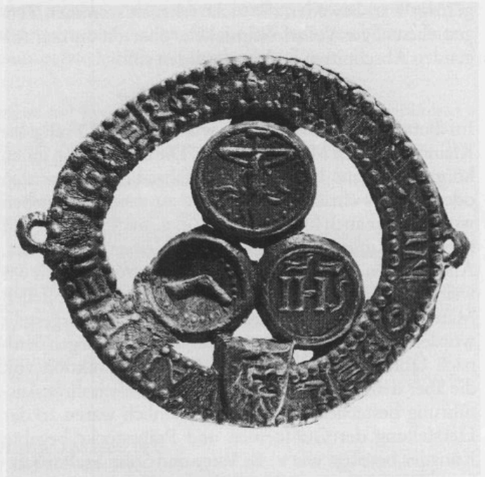
Abb. 3: Gitterguß mit den drei Hostien von Andechs.

Eine ovale, sehr dünne, beidseitig geprägte Medaille läßt sich auf diese berühmte marianische Gnadenstätte beziehen. Sie besteht aus einer messingähnlichen Kupferlegierung. Ihre Erhaltung läßt etwas zu wünschen übrig, da sie einmal randlich etwas verbogen ist und zum anderen stellenweise einen schwarzen, in Säuren unlöslichen