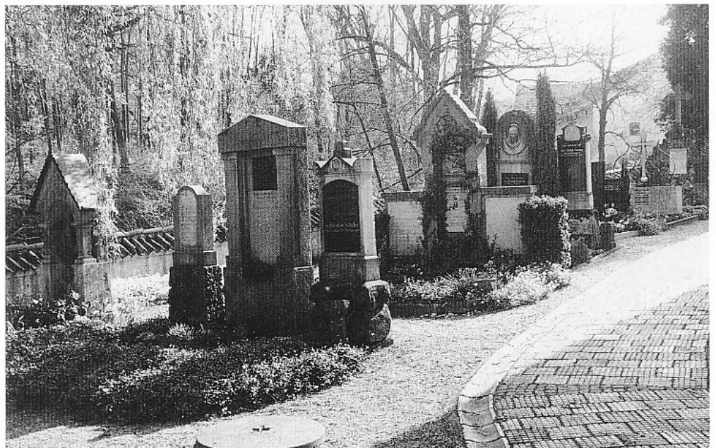
Teilansicht des Pfaffinger Friedhofs mit gut erhaltenem Bestand an alten Grabmälern.

Der »Deutsche Heimatbund« (DHB) – die 1904 ins Leben gerufene Dachorganisation der derzeit 13 Heimatverbände in der Bundesrepublik Deutschland – hat 1988