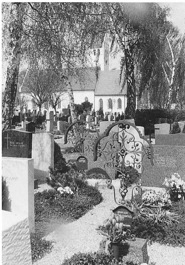
Die Dorfkirche St. Martin mit Friedhof in Germering.

Interessant ist ein heutiger Vergleich mit dem 1892 erschienenen Band »Kunstdenkmale des Königreichs Bayern«, wo bedeutende Grabsteine jeweils besonders aufgeführt werden. Sie sind überwiegend an der inneren oder äußeren Kirchenmauer angebracht und erinnern meist an Priester und Adelige. Auch einige wenige Bürger sind darunter. 4 Dieser Ort war nur Privilegierten und Laien mit bischöflicher Erlaubnis gestattet. Eine Rangordnung legte vom Bischof bis zu den Kanonikern und den übrigen Geistlichen und Klerikern die genauen Begräbnisplätze fest. 5 Papst Sixtus IV. (1471–1484) hatte die Bestattung an und in den Pfarrkirchen kategorisch verboten. 1485 wurde sie jedoch durch bischöflichen Erlaß beschränkt genehmigt bei bereits vorhandenen Familiengrabstätten oder wenn »200 Gulden rheinisch zum Besten der Kirche« bezahlt wurden. Durch kurfürstliches Spezialreskript wurde in München die Bestattung innerhalb der Stadtmauer 1789 endgültig verboten. 6 In den Dörfern umrahmte der Friedhof die Kirche jedoch auch weiterhin und erfuhr bei wachsender Bevölkerung Erweiterungen.