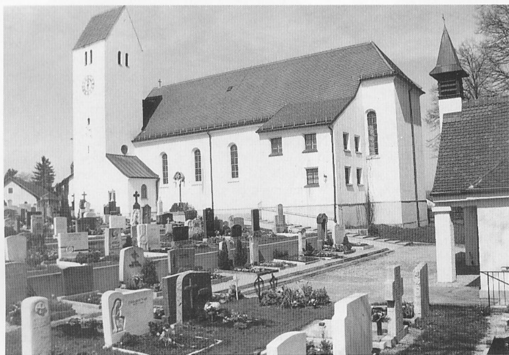
Die Pfarrkirche St. Maria Himmelfahrt mit Kirchhof von Puchheim-Ort.

Eine Schenkungsurkunde von 793/806 spricht von einem »Familienbegräbnis« in der Eigenkirche Maisach (damals St. Laurentius). 16 Die Zuverlässigkeit der gemachten Angaben darf freilich nicht überbewertet werden. Anhand der sogenannten Conradinischen Matrikel von 1315, die bereits im Jahre 1850 ediert wurde 17 und somit im Druck vorliegt, hätte man exakt feststellen können, welche Begräbnisplätze in unserem Raum, soweit er zum Bistum Freising gehörte, bereits im Jahre 1315 bestanden. Es waren dies im damaligen Dekana-