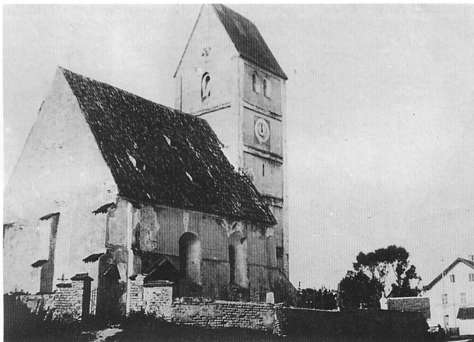
Die 1903 abgebrochene Dorfkirche St. Peter und Paul mit ummauertem Friedhof in Olching um 1900.

Das Taufrecht war das erste Recht einer Seelsorgekirche (»ecclesiae baptismales«). Das zweite Recht aber war das Bestattungsrecht (»cum sepulturis«) und damit der Besitz eines Friedhofes. Die Bestattung vor oder neben der Kirche war aber auf altbayerischem Gebiet zunächst